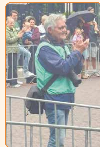
Fotograaf Frank van Welie in actie