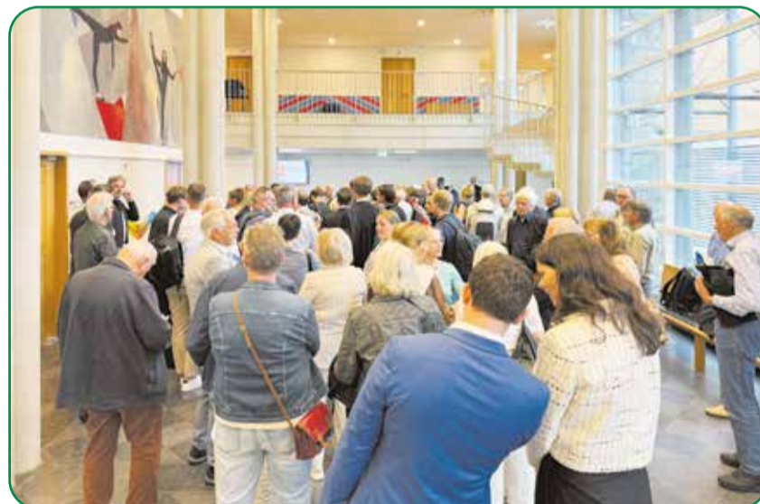
Mensen wachten om de rechtszaal in te gaan

Er wordt afgewacht wat de rechter gaat beslissen en of deze onverkwikkelijke zaak nu eindelijk eens afgesloten kan worden.