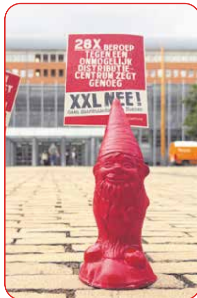
Ook het kleine rode kabouterstijp ging naar de rechtszitting

De maatschappelijke weerstand tegen het plan is en blijft enorm groot in zowel Nuenen als Geldrop. Het is wellicht mede daarom dat ook de gemeente zelf inmiddels blij geeft van twijfels. In september dient er weer een zaak, namelijk van de gemeente Nuenen zelf die graag het contract met de bouwers, BanBouw en Moeskops, in de papierversnipperaars wil gooien. Ook dit moet langs de meetlat van de wet gelegd: volgens de gemeente had de grond allang door hen gekocht moeten zijn. Nu loopt de gemeente 21 miljoen euro (voorlopig) mis en er is geld nodig, want de