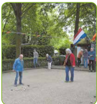
Volkssport Jeu de boules wordt beoefend in Gerwen

Jeu de boules, oftewel petanque, is nog geen Olympische sport. In Frankrijk zijn diverse pogingen ondernomen om de 'volkssport' petanque tot Olympische sport uit te roepen, maar