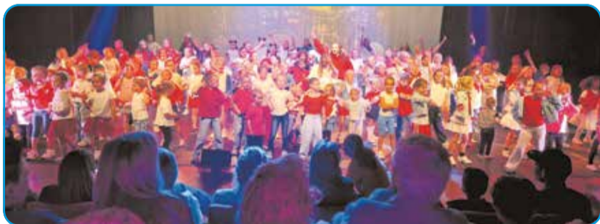
Alle leerlingen en docenten van KENO dance tijdens de gezamenlijke finale van de eindshow 'Parijs, C'est la vie' in Theater De Eendracht in Gemert."

Met deze succesvolle voorstellingen kijkt KENO dance terug op een mooi dansseizoen. De dansschool, waar plezier en ontwikkeling hand in hand gaan, bereidt zich inmiddels alweer voor op een nieuw seizoen vol dansplezier.