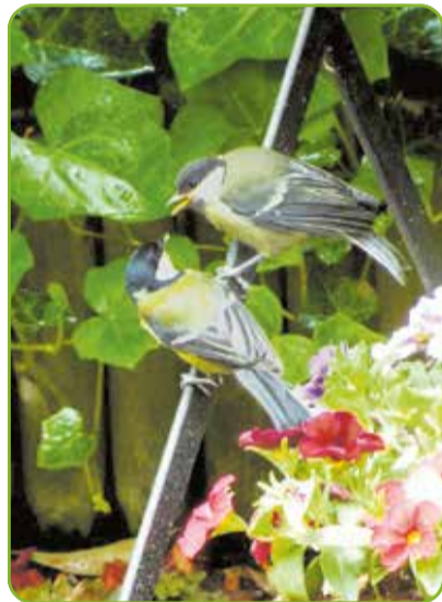
Een net uitgevlogen jong koolmeesje krijgt een hapje van moeder

www.bibliotheekdommeldal.nl/geheugenhuis of aan de balie van de bibliotheek.