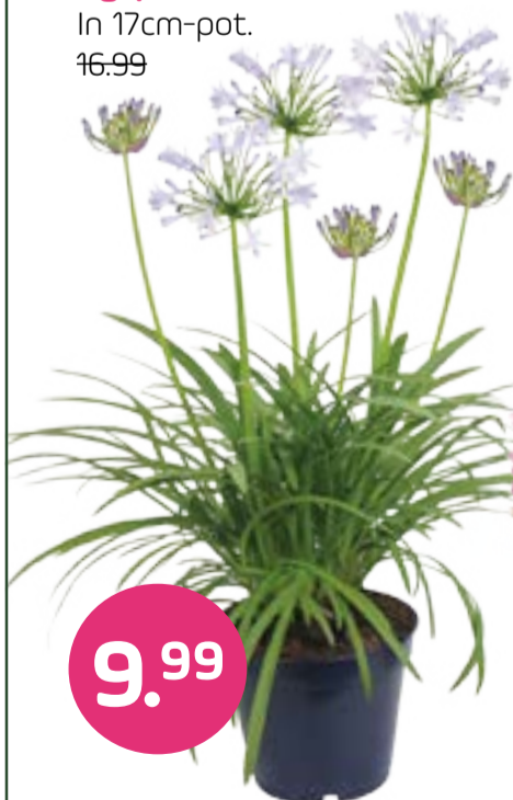
Agapanthus In 17cm-pot. 16.99