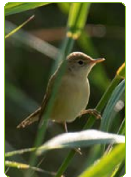
Kleine karekiet, Joop Bruurs

De start van de wandeling is bij de Collse Watermolen. Het gebied heeft een afwisselend karakter met bos, water en weiden. Interessante vogels die je hier kunt treffen zijn onder andere de kleine karekiet, tuinfluiter, grote gele kwikstaart en buizerd. Ook de blauwborst en nachtegaal worden af en toe in het gebied gehoord en gezien.