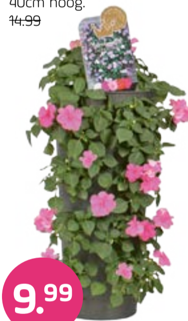
Wanderella hangstelsel 40cm hoog. 14.99