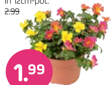
Portulaca Meer kleuren per potje. In 12cm-pot. 2.99