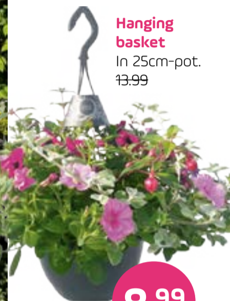
Hanging basket In 25cm-pot. 13.99

Ease Up Lazize 3-delig loungeset Sunproof textiel. 299.- 249.-