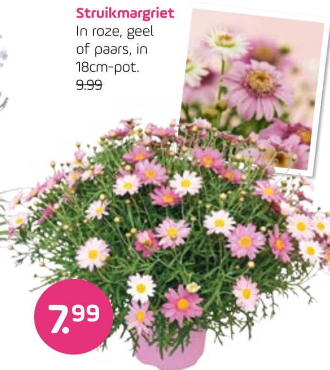
Struikmargriet In roze, geel of paars, in 18cm-pot. 9.99