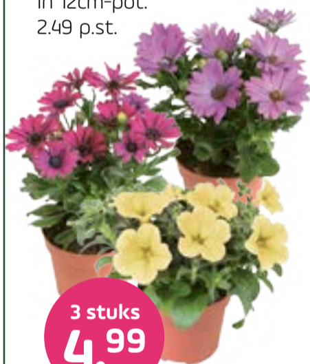
Petunia Surfinia of Spaanse margriet In 12cm-pot. 2.49 p.st.