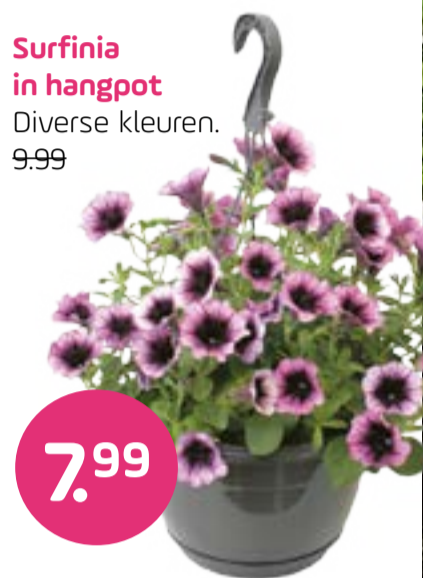
Surfinia in hangpot Diverse kleuren. 9.99

Nuenen Kapperdoesweg 8 | 10 mei Moederdag open!