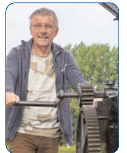
Tekst en foto Frank van Welie

Hierbij stond Hennie bekend als vasthoudend en principieel. Het plotselinge overlijden van Hennie is een grote schok voor allen, die zich nauw verbonden voelen met de iconische molen van Nuenen.