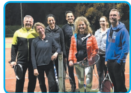
Gemengd dubbel 35+ vrijdagavond derde klasse:

Dit najaar zijn er bij TVW tijdens de najaarscompetitie drie seniorenteams kampioen geworden en twee juniorenteams. TV Wettenseind feliciteert alle kampioenen. Op naar de wintercompetitie!