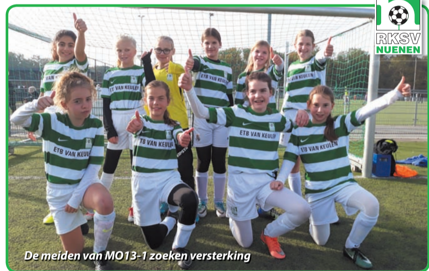
De meiden van MO13-1 zoeken versterking

Wij zijn 10 gezellige meiden in de leeftijd van 11 t/m 13 jaar. Samen voetballen wij met veel plezier. Wij trainen op maandag en woensdagavond van 18.45 / 20.00 uur, en spelen op de zaterdag onze wedstrijden, super leuk. Wil jij ons team versterken? Kom vrijblijvend een keer mee trainen (vooraf aanmelden is niet nodig) of bel met vragen 06-12530080. Overigens, RKSv Nuene heeft ook meidenteams in alle andere leeftijdscategorieën. Ook zij kunnen altijd versterking gebruiken.