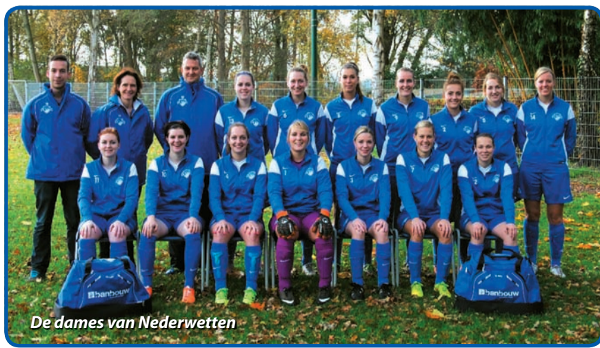
De dames van Nederwetten

Een enthousiaste trainer(ster) / coach, die de balans tussen gezelligheid en prestatie bewaakt.