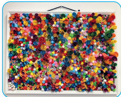
Gezamenlijk gemaakt kunstwerk

Apotheek Aan de Berg, Berg 22b. Maandag t/m vrijdag 08.00 - 18.00 uur.