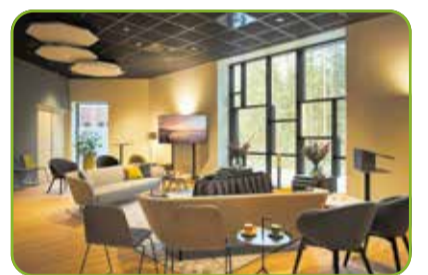
De vernieuwde huiskamer

De lange tafels voor de cake zijn getransformeerd in een heuse brasserie waar ook een aangeklede borrel genuttigd kan worden na de ceremonie en voor de familie is er een sfeervolle