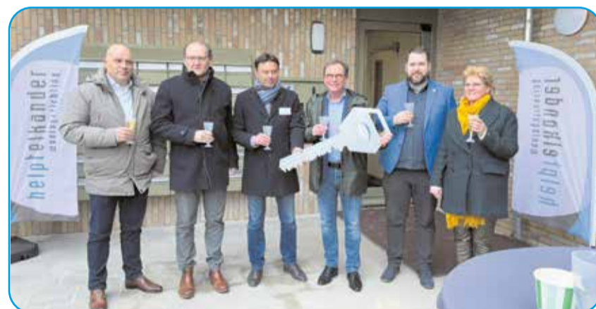
Sleuteloverhandiging aan Lunet