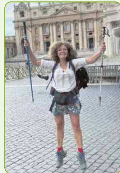
Aankomst in Rome, Sint-Pietersplein

Tegenwoordig loopt ze pelgrimspaden dichterbij huis, zoals het Pieterpad en Limespad. Momenteel loopt ze met een vriendin delen van de Camino Brabant, en met haar man het pelgrimspad van Amsterdam naar Maastricht. Maar ze sluit niet uit dat ze nog eens een camino over de grens gaat lopen.