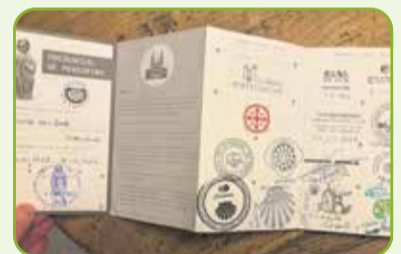
Verzamelde stempels voor de pelgrimspas