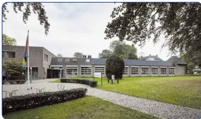
Staat er in 2028 een nieuw gemeentehuis?

Volop plannen en projecten en voldoende geld om alles te realiseren zonder een graai te doen in de beurs van de burger. Dat was de optimistische conclusie van deze middag, die onderbouwd werd met een uitvoerige en secuur ogende boekhouding. Grote ambities, grote bedragen, het kan niet op.