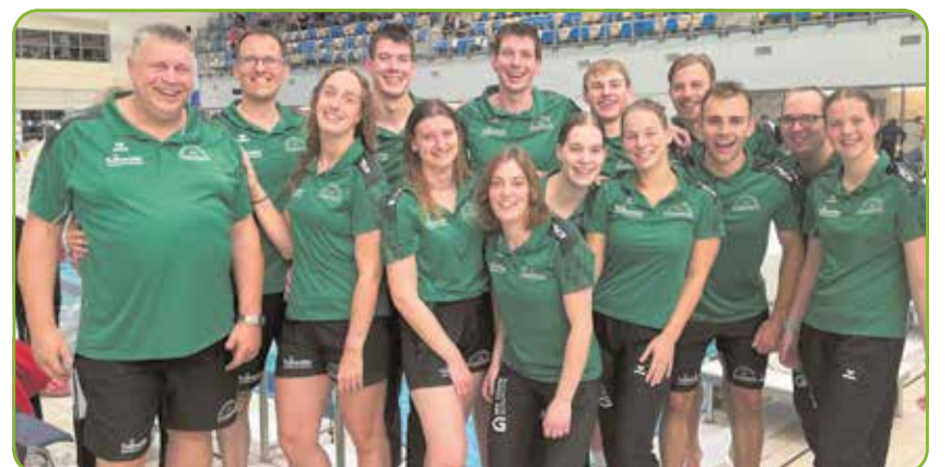
Het team van Z&PV Nuenen bij de NK estafette