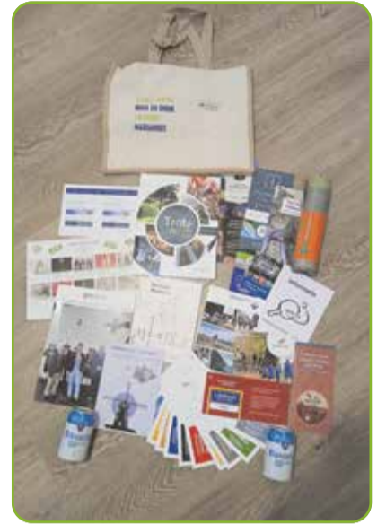
Het welkomspakket zit boordevol informatie én voordelen voor de nieuwe bewoners

In het Lieshoutse pakket zit natuurlijk een brochure van "Ons Tejater": hét theater in het Dorpshuis in Lieshout. Ook zit er informatie in over de lokale KBO-afdeling, van de seniorenvereniging en informatie over de -overigens zeer actieve- heemkundekring "t Hof van Liessent". Ook zit er een waaier in die samengesteld is door lokale ondernemers waarmee korting verkregen kan worden bij een aankoop of bezoek. Ook zitten er flyers van diverse clubs en verenigingen in en wordt het geheel aangevuld met enkele fietsroutes, zodat de nieuwe inwoner snel en eenvoudig