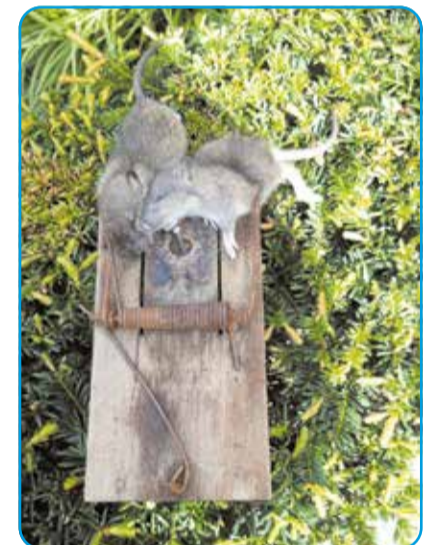
Twee ratten in één klem

Een vogelvriend meldde mij vorige week dat er jonge koolmeesjes dood in zijn nestkastje lagen. Er zijn in onze gemeente honderden nestkastjes opgehangen om koolmeesjes een prettig onderdak te bieden. Koolme-