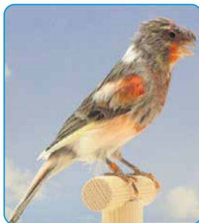
Alequim Portugals met kuif

Alle vogels zijn nu weer thuis en zullen weer hun best mogen doen om voor nakomelingen te zorgen zodat ook zij volgend jaar weer een gooi naar de diverse titels kunnen doen. Wilt u meer weten over vogels in de volière of vogels in het algemeen neem dan een kijkje op de site van de Nuenense vogelvereniging, vvdebastarden.nl . Via die site kunt u ook altijd contact opnemen.