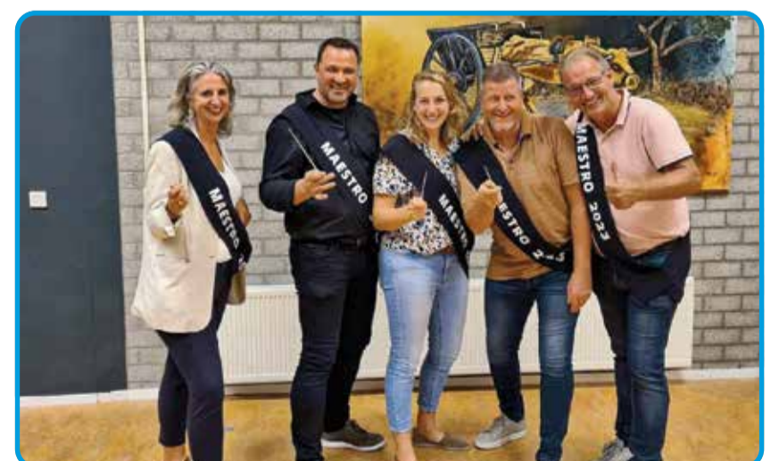
De Maestro's 2023