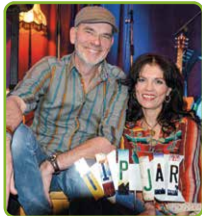
TIP JAR geeft zondag 5 februari een lunchconcert in De Stam in Gerwen