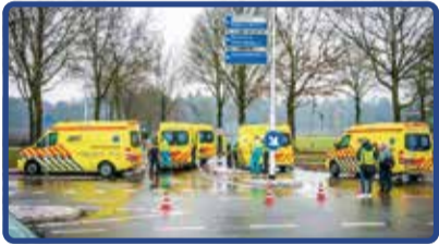
Er zit weinig schot in de geplande renovatie van de kruising N615 en Deense Hoek

Een van de weinige berichten die hierover gekomen is was in september waarin gemeld werd dat de verdere ontwikkeling overgezet was naar een realisatieteam. Toen is ook gemeld dat er een nieuw verkeersmodel zou komen, waardoor betere