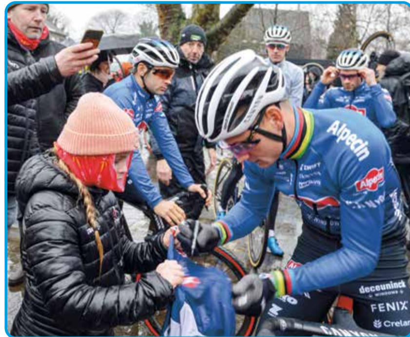
Een jeugdige wielersfan scoort een handtekening van Mathieu van de Poel