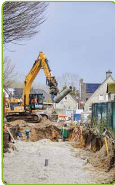
Het bouwrijp maken in het geplande gebied vordert gestaag...

Er zijn dus dertig woningen gepland in genoemd gebied. Woningen van verschillende typen, zoals twee-onder-één-kappers, vrijstaande wonin-