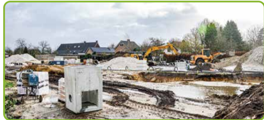
Vanaf de Hoekstraat wordt het gebied ontsloten

gen en rijtjeshuizen. De huizen worden uitgevoerd als één bouwlaag met kap of twee bouwlagen met kap. Bij de woning is ruimte voor een vrijstaand en/of aangebouwd bijgebouw met één bouwlaag. In het allereerste plan was 2021 genoemd als startjaar voor de bouw. Dan zouden de eerste bewoners in 2022 hun intrek kunnen nemen in de nieuwe woningen. Het hangt van het bouwtempo af of er in de loop van dit jaar woningen opgeleverd gaan worden.