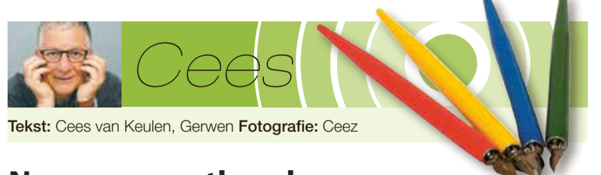
Tekst: Cees van Keulen, Gerwen