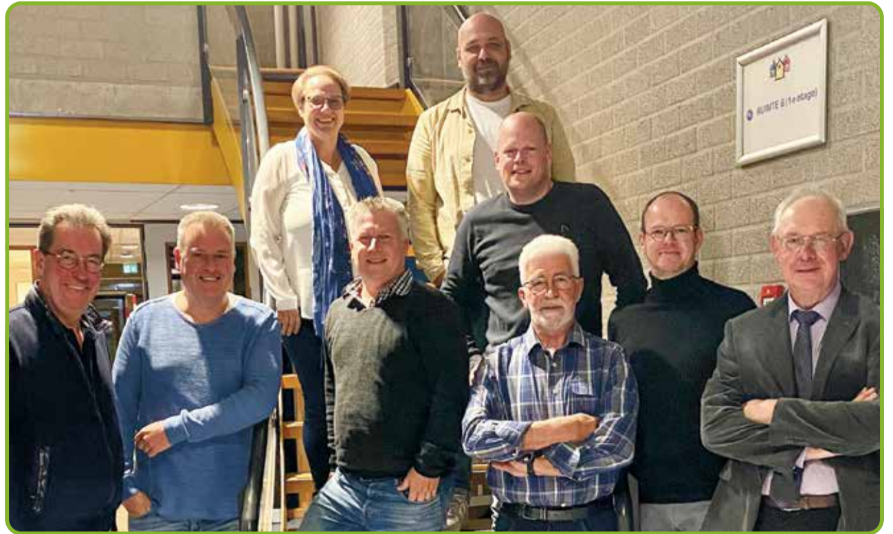
Dorpsraad Lieshout zoekt versterking om de leefbaarheid van Lieshout verder te kunnen optimaliseren

Zoals aangegeven zijn er enkele belangrijke aandachtgebieden. De leden van de Dorpsraad verdelen deze aandachtgebieden onder elkaar, zodat iedereen een taak op zich kan nemen die hem/haar het beste past. Ook nieuwe leden kunnen dus een 'eigen takenpakket' samenstellen en zich bezighouden met hetgeen ze het beste past. Wilt u ook in de Dorpsraad? Stuur dan een kort berichtje met uw motivatie naar info@dorpsraad-lieshout.nl en meld u aan. Wilt u zien waar de Dorpsraad zich mee bezig houdt? Kijk dan regelmatig op de site via www.dorpsraad-lieshout.nl .