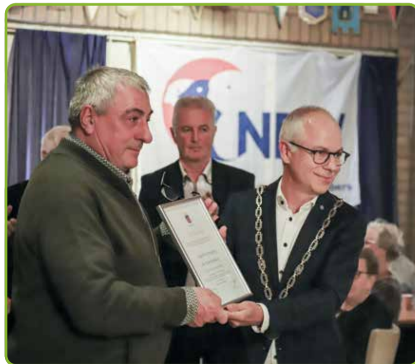
Nuenense vogelvereniging De Bastaarden ontvangt Zilveren erepenning

Met deze zilveren gemeentelijke onderscheiding wil het gemeentebestuur, uit naam van alle inwoners in het algemeen en voor alle leden van vogelvereniging De Bastaarden in het bijzonder, zijn waardering en erkentelijkheid uitdrukken.