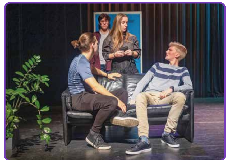
Repetities zijn voor de vierde keer gestart

De kaartverkoop is inmiddels gestart. De 7 van de Breakfast Club wordt gespeeld van 18 tot en met 20 november in Het Klooster. Er zijn 2 avondvullende voorstellingen en 1 middagvoorstelling. Kaarten zijn, zeker in deze dure tijden, vriendelijk geprijsd. Het maakt een leuke avond of middag uit betaalbaar. Reserveren kan via www.lindespelers.nl