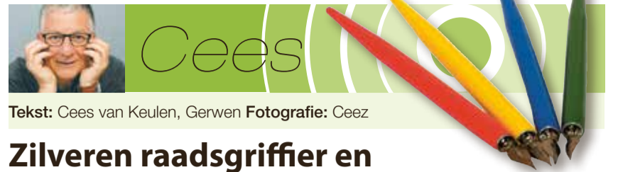
Tekst: Cees van Keulen, Gerwen