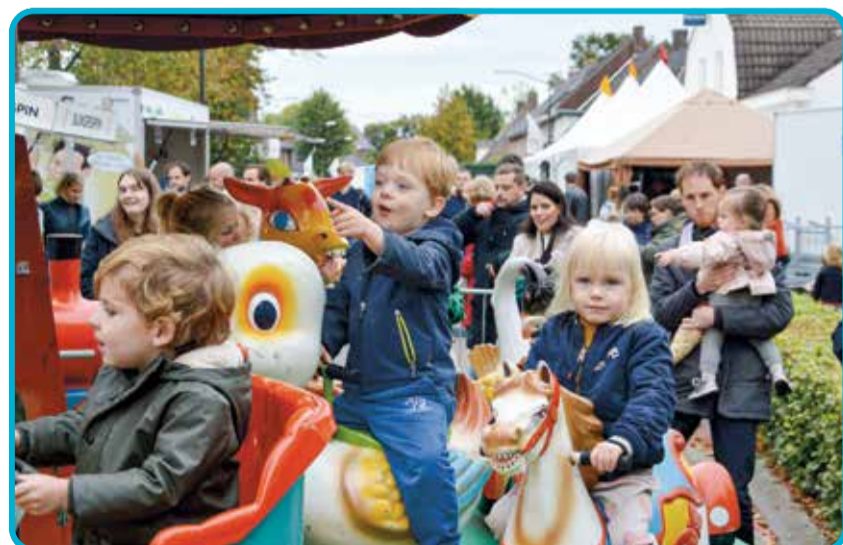
Gerwen Kermis met diverse attracties zoals klimtoren en draaimolen

De kermis wordt maandag vanaf 18.00 uur traditioneel afgesloten met een spetterend optreden van Duo Markant. Dit markante duo behoeft geen introductie meer: het is namelijk niet de eerste keer dat zij Gerwen Kermis feestelijk afsluiten. Het dak gaat eraf! Dat is zeker!