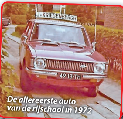
De allereerste auto van de rijkschool in 1972

Sinds 2018 is de rijkschool gevestigd aan de Spiegel in Nuenen, voorheen stonden de kenmerkende rode auto's bij de Keizershof en daarna in de Weverstraat. Het wagenpark is in die jaren gegroeid van twee naar acht auto's, twee motors, bestelwagens met