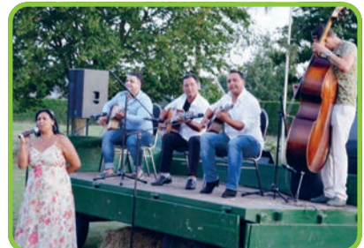
Optreden in de open lucht bij Het Huysven in Gerwen.....

De poort van Het Huysven wordt vrijdagavond 17 juni om 19.30 uur geopend. Het concert begint om 20.00 uur. Auto's parkeren kan op het Kerkplein in de dorpskern Gerwen, op 7 minuten lopen ligt Het Huysven. Per fiets of te voet komen kan natuurlijk ook. Locatie: Het Huysven, Huikert 35, 5674 RG Gerwen.