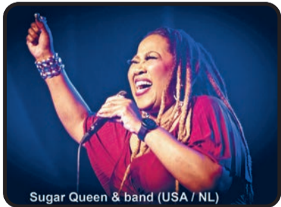
Sugar Queen & band (USA / NL)

5 juni, Park Nuenen, 14.00 - 19.00 uur. Voor info: www.sunnybluesnuenen.nl