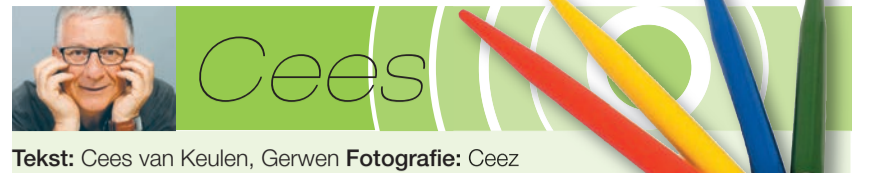
Tekst: Cees van Keulen, Gerwen

Hebt u een idee of een tip voor een door LON TV te verzorgen reportage? Stuur dan een e-mail naar tv@omroepnuenen.nl