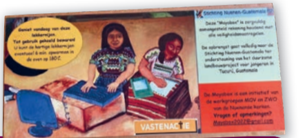
De kleurige Mayabox

Wilt u het project ook steunen dan kan dit door een gift over te maken op bankrekening NL64 RABO 0101 7384 20 t.n.v. Stichting Nueneen-Guatemala.