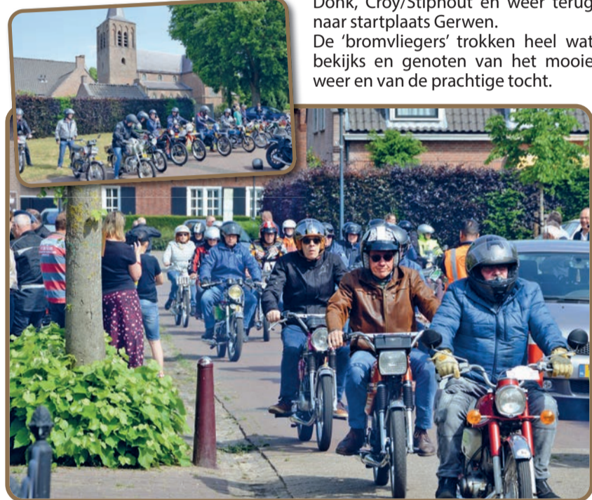
De oldtimerbrommers vertrokken vanuit Gerwen voor een voorjaarsrit...

de voorjaarsrit van 'De Bromvliegers', een actieve oldtimerbromfietsclub uit deze regio. Een tochtje van 83 kilometers door Geldrop, Lierop, Asten, Deurne, Zeilberg, Bakel, Beek en Donk, Croy/Stiphout en weer terug naar startplaats Gerwen. De 'bromvliegers' trokken heel wat bekijks en genoten van het mooie weer en van de prachtige tocht.