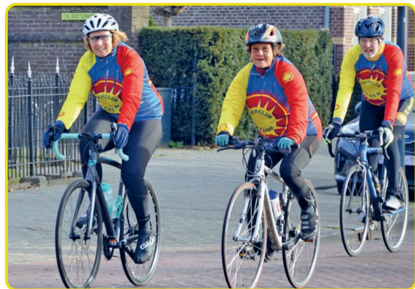
Deelnemers aan de Van Goghfietsstoertochten hebben de keuze uit vier afstanden: 50, 85, 115 en 150 kilometer....

Deelnemers dienen zich voor vertrek in te schrijven bij café Schafrath in Nuenen. Dat kan tussen 08.00 uur en 09.30 uur. Deelname kost € 4,- en voor leden van de Nederlandse Toerfiettsunie (NTFU) € 3,- (beide incl. consumptiebon). Bij terugkomst kunnen de deelnemers nagenieten op het gezellige terras bij Schafrath.