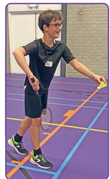
Badminton is de snelste zaalsport ter wereld!

Indien je geen kans hebt om deel te nemen aan 'de Roefeldag' en toch kennis wil maken met BCL kan dat natuurlijk toch. Kom dan langs op een van de komende speeldagen (steeds op woensdag, tussen 18.30 en 20.00 uur) bij de thuishaven van BCL: sporthal 'de Klumper' aan de Papehoef in Lieshout. Als je je sportkleding én je sportschoenen meebrengt, kun je meteen een keer uitproberen en meedoen: een racket kun je immers altijd van BCL lenen.