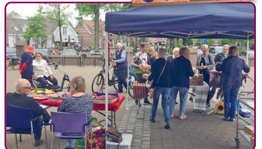
Het was gezellig druk op het kerkplein bij de verkoop van de Mayabox