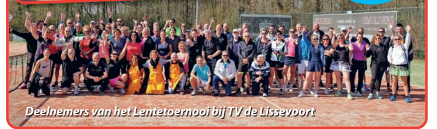
Deelnemers van het Lentetoernooi bij TV de Lissevoort