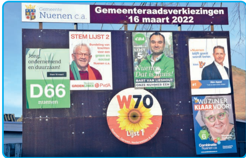
Posters sieren de gemeentelijke verkiezingsborden...

Zeven lijsten met zo'n 140 kandidaten dingen mee naar 19 zetels in de nieuwe Nuenense gemeenteraad. Woensdag 16 maart kunnen de kiezers in de gemeente Nuenen, Gerwen en Nederwetten naar de stembus voor de verkiezingen van de nieuwe raad. Op het stembiljet komen de zeven partij-netjes naast elkaar te staan. De volgorde is inmiddels vastgesteld.