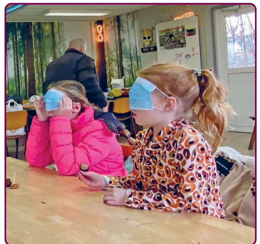
Blind proeven kan prima met een mondkapje!