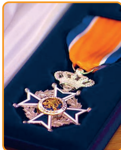
Afgelopen jaar werden slechts een paar Lieshoutenaren geëerd met een lintje.

In praktijk is het overigens heel wat werk om een vrijwilliger aan te dragen voor bijv. een lintje: om die reden wordt geadviseerd er op tijd mee te beginnen. Wie pakt de handschoen op en zorgt dat degene die het verdient binnenkort eens op het -welverdiende- voetstuk wordt geplaatst?