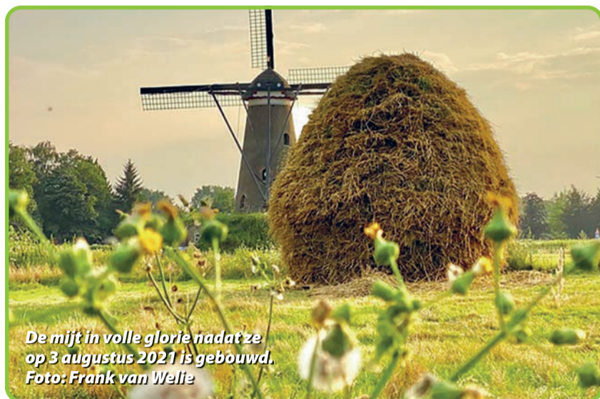
De mijt in volle glorie nadat ze op 3 augustus 2021 is gebouwd.