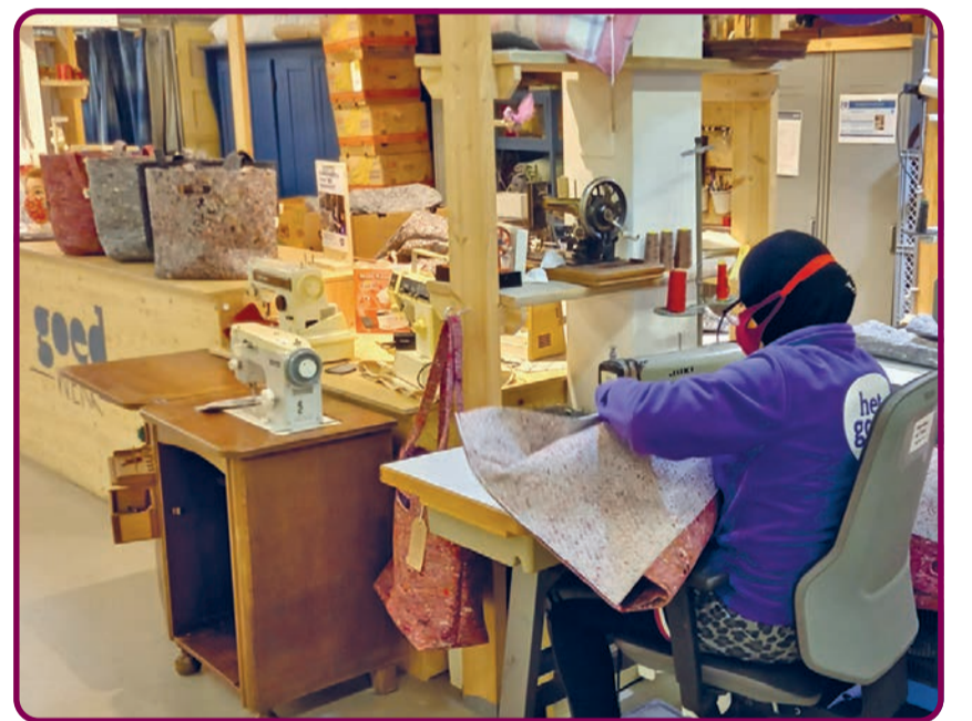
Bij Het Goed worden van oud textiel nieuwe tassen gemaakt.