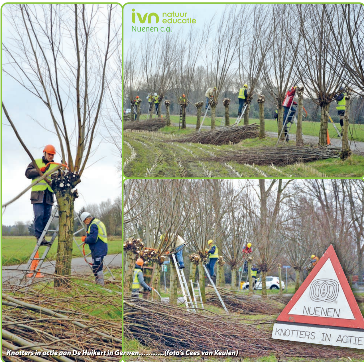
Knotters in actie aan De Huikert in Gerwen.....

De kruinen van de knotwilgen aan De Huikert in Gerwen staan er weer kortgeknipt bij. Zaterdag 29 januari was de knotgroep van het IVN-Nuenen c.a. met vijftien leden in actie in Gerwen. De IVN-ers zijn, uitgerust met helmen en werkhandschoenen, een paar uurtjes druk met het knotten van de kruinen. Het handgereedschap zoals snoeischaars en zagen wordt verzorgd door het IVN. De winterperiode is het werkseizoen voor de knotgroep en op zaterdag komen de knotters in actie. Het meest voorkomende werk is het knotten van knotwilgen. Dat gebeurt om de 3 of 4 jaar. Elke winter worden zo'n vier- à vijfhonderd knotwilgen 'kortgeknipt'. Knotters zijn welkom en ook niet-leden mogen meewerken. Belangstellenden kunnen meer informatie vinden op de site van het IVN: www.IVN.nl/Nuenen .