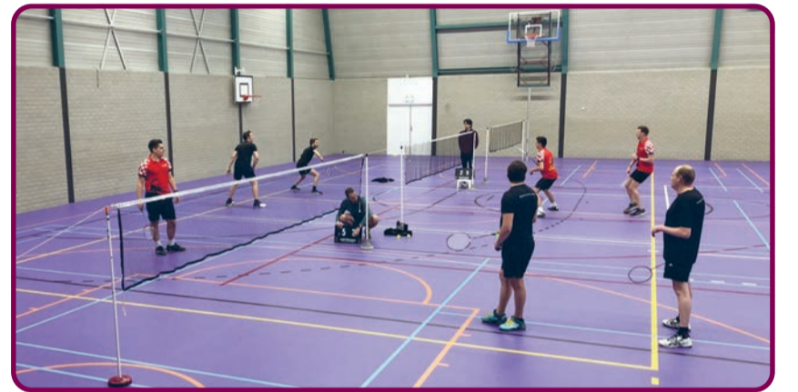
Naast trainen mag er ook weer competitie gespeeld worden door Badminton Club Lieshout

Badminton Club Lieshout neemt met twee teams deel aan de (natio-