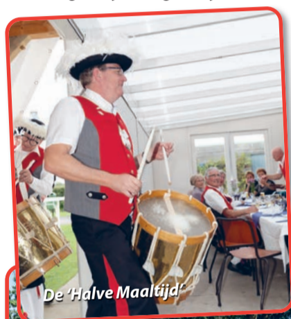
De 'Halve Maaltijd'

Mocht u interesse hebben in de tradities en geschiedenis van het Heilig Kruisgilde dan bent u elke zondag tussen 11.00 en 14.00 uur van harte welkom op ons Gildeterrein 'de Schutsherd' aan het Lankveld in Gerwen.