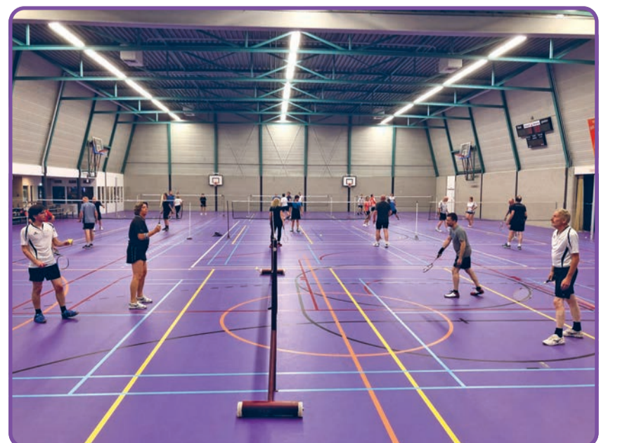
Badminton: op de camping een spel, maar in de zaal een leuke sport

Woensdag, 8 september, 18.30 uur; Eerste speelavond seizoen 2021/2022 Woensdag, 15 september, vanaf 18.30 uur; Rabobank Inloopdag (1), Jeugd. Woensdag, 15 september, vanaf 20.00 uur; Rabobank Inloopdag (1), Senioren