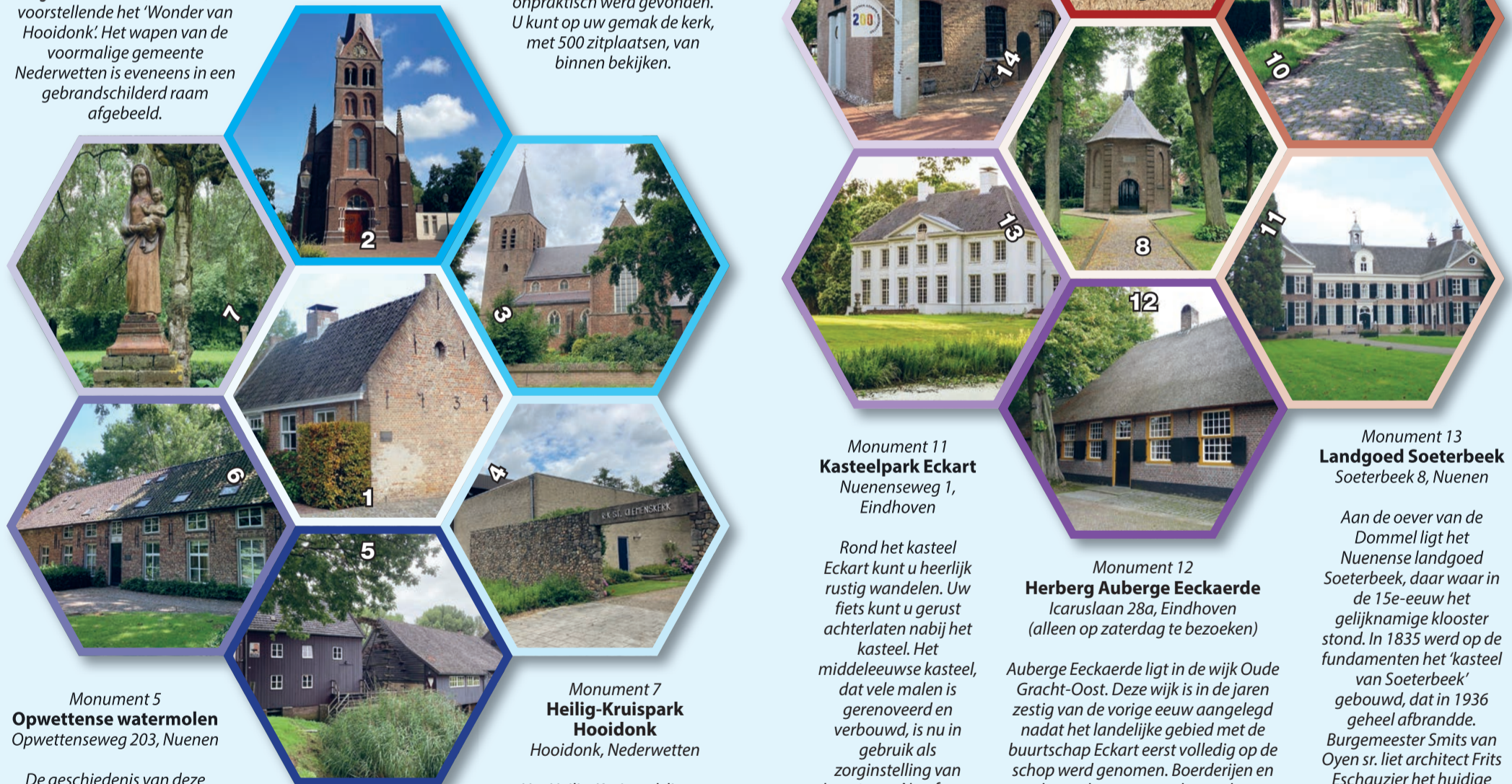
Monument 5 Opwettense watermolen Opwettenseweg 203, Nuenen

Op 1 oktober 1866 werden de lijn en het station met het spoorwaghuis bij de overweg in gebruik genomen. Een heuse 'harde' weg werd er langs het spoor aangelegd: De Stationsweg. In 1885 werd deze met een kasseienbestrating, 'kinderkopjes', geplaveid en werd het een onderdeel van de straatweg tussen Geldrop en Nuenen-dorp. Tot op de dag van vandaag is de weg nog steeds met dezelfde kasseien bestraat. Op beide dagen zijn er diverse activiteiten gepland.