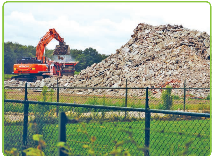
Het puin van de gesloopte varkensstallen wordt gebroken. Bij de Heyde Hoeve in Gerwen wordt een nieuwe loods gebouwd.... (foto Cees van Keulen).

Vier keer Goud en een Prix D'Honneur Heyde Hoeve nam dit jaar voor het eerst deel aan de internationale vakwedstrijd van de Confrérie des Chevaliers. Aan dit concours nemen ambachtelijke slaggers en producenten uit heel Europa deel. Heyde Hoeve behaalde met de vier ingezonden ambachtelijke producten 'Goud'. Heyde Hoeve werd ook onderscheiden met de Prix d'Honneur. Goud werd behaald met de volgende vier ambachtelijke producten met het Heyde Hoeve Duroc varkensvlees als belangrijkste ingrediënt: gekookte achterham, zachte boerenmetworst, hausmacher en gebraden gehakt met peper. Voor meer informatie: www.heydehoeve.nl