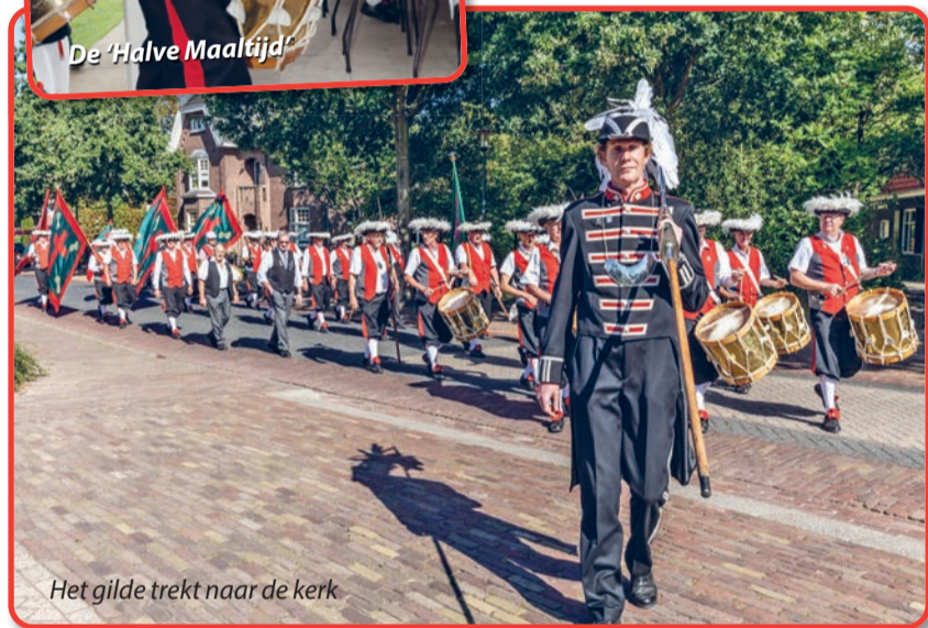
Het gilde trekt naar de kerk