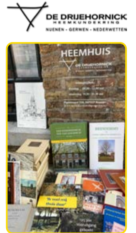
Heemkundekring De Drijehornick houdt zaterdag 21 augustus een zomer-boekenmarkt in het Heemhuis.

De zomer-boekenmarkt wordt gehouden op zaterdag 21 augustus tussen 11.00 en 14.00 uur in het Heemhuis van De Drijehornick, Papenvoort 15A nabij het gemeentehuis.