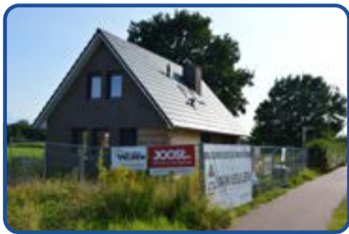
Een huis in aanbouw aan de Gerwenseweg in Gerwen, bijna gereed....

Tijdens de bouwvak zijn bouwbedrijven in de regel ook daadwerkelijk dicht en wordt er weinig of niet gebouwd. Goed om eens te kijken hoe de vlag er bij hangt bij bouwprojecten in onze gemeente. Bij bouwactiviteiten groot en klein. En soms zie je nog wel bouwvakkers of zelfklussers in actie in deze zomervakantie, bij de bouw van een (eigen) huis, van een aanbouw of de renovatie van een woning.