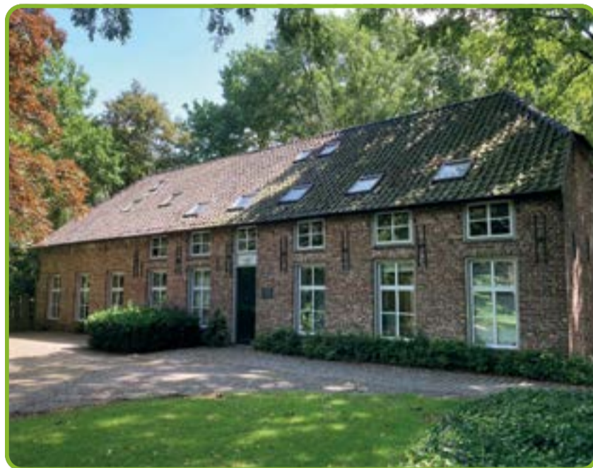
De voormalige linnenweverij en expositieruimte 't Weefhuis is tijdens het Open Monumentenweekend te bezoeken.