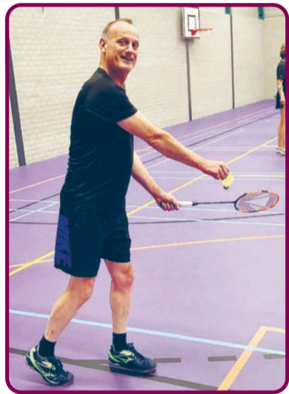
Badminton; een leuke sport voor alle leeftijden!

Badminton Club Lieshout wenst iedereen een héle fijne zomervakantie en graag tot ziens op 8 september 2021!