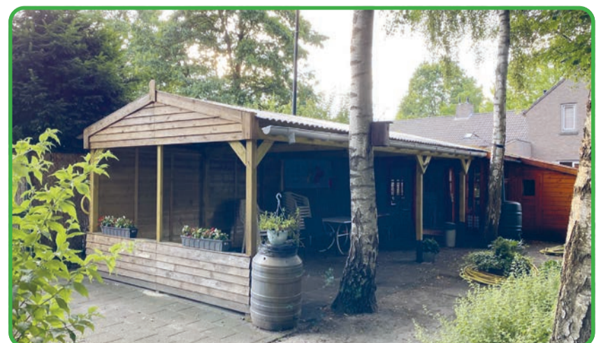
De overkapping in het wandelparkje achter het Fransiscushof is mede tot stand gekomen door financiële ondersteuning vanuit de Dorpsraad Lieshout.

Heeft u twijfel of uw evenement ondersteund zou kunnen worden? Doe dan navraag bij de Dorpsraad via info@dorpsraad-lieshout.nl of vul het aanvraagformulier in. Wellicht kan uw evenement immers zomaar extra ondersteund worden!