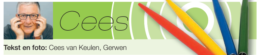
Tekst en foto: Cees van Keulen, Gerwen

Lijkt het je leuk om actief deelnemer te worden van deze gezellige Stichting; neem dan contact op met Sjors Driessen via 06-20957959 of info@sinterklaasnuene.nl