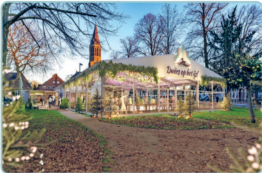
Visualisatie van hoe de ijsbaan er straks uit kan komen te zien in het Park

In het komende halfjaar moet de organisatie van Dwèrs op het ijs flink aan de bak om het ijsfeest neer te zetten. Denk aan het regelen van de benodigde vergunningen, het opzetten van de activiteiten voor de ijsbaan en in het Wintercafé, vrijwilligersplanningen maken, inrichten van de tent. En de sponsorcommissie blijft natuurlijk doorgaan om genoeg geld binnen te halen om dit evenement te kunnen neerzetten. Wil jij Dwèrs op het ijs ook mee mogelijk maken door de stichting te sponsoren? Laat het de organisatie dan weten via de website. www.dwersophetijis.nl