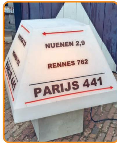
Paddenstoel bij de molen wijst de weg naar Nuenen en naar Parijs, finishplaats van de Tour de France....