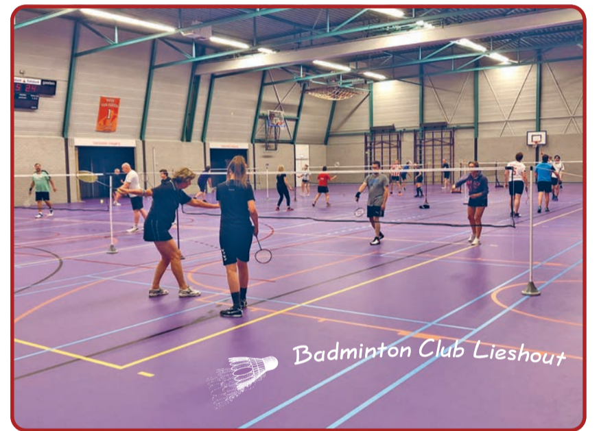
Badminton Club Lieshout