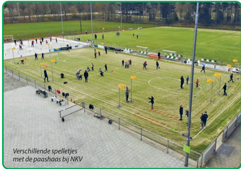
Verskillende spelletjes met de paashaas bij NKV

pels werd er onderling gestreden om een eerste plaats. Een heuse competitieve strijd voerde al snel de hoofdmoot, waarschijnlijk door het gebrek aan het niet kunnen spelen van een echte competitie. Al snel stonden de dames van de selectie voorop. Dit alles natuurlijk met de inachtneming van de 1,5 meter afstand. Al met al hebben we met z'n allen een supergezellige tijd met elkaar gehad met de nodige sportieve uitdagingen.