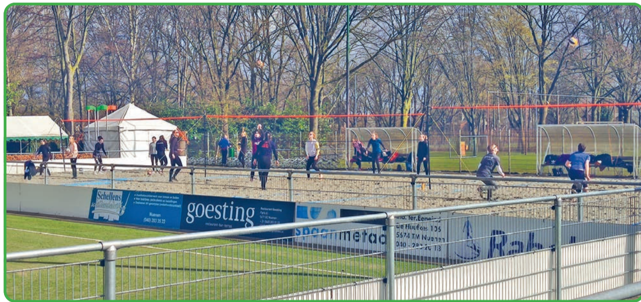
Ook beachvolleybal op NKV terrein