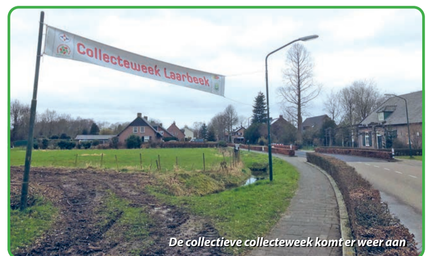
De collectieve collectieweek komt er weer aan

Kijk voor meer informatie op de site: www.dorpsraad-lieshout.nl