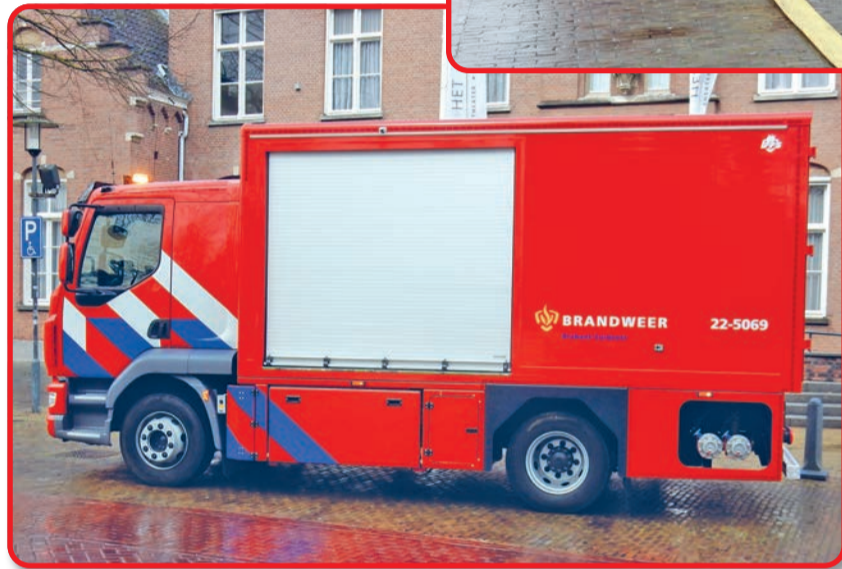
De nieuwe WTS400 van de Nuenense brandweer kan water verplaatsen over 400 tot max. 500 meter

gen. Naast de WTS400 beschikt brandweer Nuenen ook over een tankautospuit. Deze wordt ingezet in meest voorkomende brandweer gerelateerde incidenten. Daarnaast zijn er in Nuenen ook verschillende vrijwilligers opgeleid als Verkenner gevaarlijke stoffen. Bij een groot incident of bij een vermoeden van gevaarlijke stoffen wordt dit voertuig opgeroepen. Deze verkenningseenheid is ook een regionale functie en bestrijkt dus een groot gebied van deze regio.