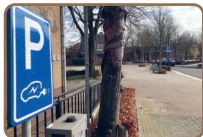
Dorpsraad Lieshout ziet het aantal laadpalen graag toenemen in Lieshout

Kijk ook eens op de website: www.dorpsraad-lieshout.nl