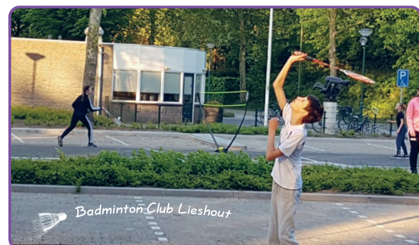
Buiten-badminton voor de jeugd biedt wellicht mogelijkheden om aan de slag te gaan

Overigens heeft het bestuur, mede op aandringen van de leden tijdens de recente Algemene Leden Vergadering, besloten om in het eerste kwartaal van 2021, een periode waarin totaal niet gesport kon worden, (achteraf) géén contributie te heffen bij de jeugd. Gebleken is immers dat de jeugd als eerste afscheid neemt van een vereniging, als de contributie doorloopt tijdens een lockdown. Ter voorkoming van opzeggingen wordt daarom de inning van contributie bij deze groep (voorlopig) stilgelegd. Hierdoor kan de jeugd, kosteloos, gewoon lid blijven van de vereniging, met als doel om snel weer aan de slag te kunnen.