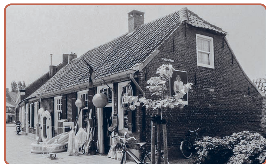
Sloekes zoals het was, de legendarische snoep- en speelgoedwinkel op de hoek Berg/Weverstraat

Of zoals Ronald het zegt: "Met iets kleins iets groots terug brengen."