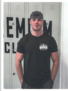
DAAN Personal Trainer Kracht / bodybuilding