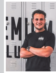
GIEL Personal Trainer Club Manager Bootcamp / Boxing

AKTIE : ALLE EX-MEMBERS VAN VOOR SEPTEMBER 2020 SPORTEN DE GEHELE MAAND FEBRUARI GRATIS BIJ CARDO PREMIUM SPORTS CLUB NUENEN