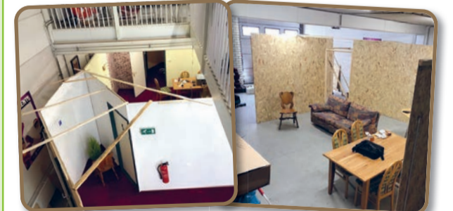
Decor van bovenaf

Het zonnetje in huis Gijs is het na de zoveelste nutteloze discussie aan de ontbijttafel kotsbeu en besluit ook het huis uit te gaan en bij Bram in te trekken. Bram ziet dit in eerste instantie niet zitten, maar stemt uiteindelijk toch toe. Barbara wil dat Gijs echter zo snel mogelijk terug naar huis komt, terwijl Gerard er vrij nuchter onder blijft. Het samenwonen van de broers gaat echter niet zonder ergernissen. Gelukkig helpt oma Tilly haar kleinkinderen een handje. Bo nodigt Bram uit om samen te gaan midgetgolven in Helmond. Wat een gezellig uitje had moeten worden, eindigt niet zonder slag of stoot.