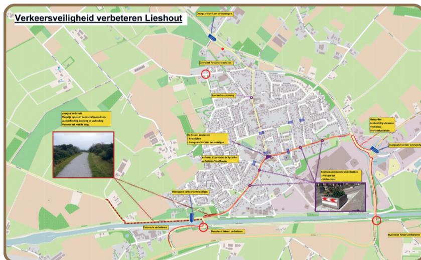
Verkeersveiligheid verbeteren in één oogopslag! (zie website voor groter beeld)

Kijk voor meer informatie op www.dorpsraad-lieshout.nl