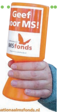
Scan de QR-code of ga naar nationalemsfonds.nl . Geef contactloos, veilig en eenmalig.