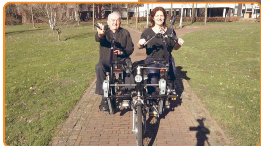
"Samen naar buiten op deze duofiets, brengt kleur in mijn dagelijkse leven"