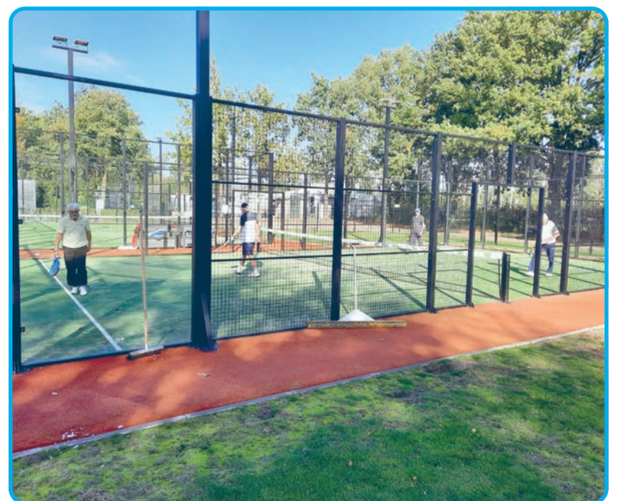
Padellen ook populair bij senioren

Tennisvereniging de Lissevoort is een actieve vereniging, die ondanks alle belemmeringen die we nu kennen volop ruimte biedt aan actieve sporters. Graag zien wij u eens op ons park. Voor informatie over onze vereniging, zie onze website www.tvdelissevoort.nl . Of stuur een email naar info@tvdelissevoort.nl