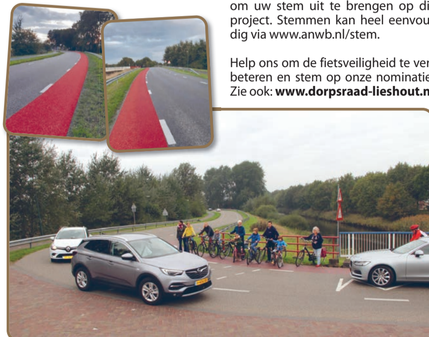
Zo zou de markering de situatie behoorlijk duidelijker én veiliger maken (links kijkend naar het westen, rechts kijken naar het oosten)

Op de brug over het Wilhelminakanaal zijn dit soort rode accentstroken al wél aangebracht. Op de aansluitende rijweg zijn deze vanwege ontoereikend budget niet aangebracht. Dorpsraad Lieshout wil daar nu graag, via deze creatieve route, een oplossing voor vinden. Met het bud-