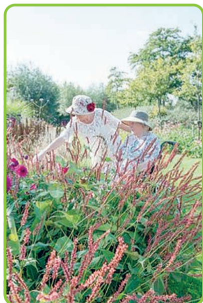
Groen doet iets met mensen en mensen doen iets met groen

Bron: Groene Steden voor een duurzaam Europa.