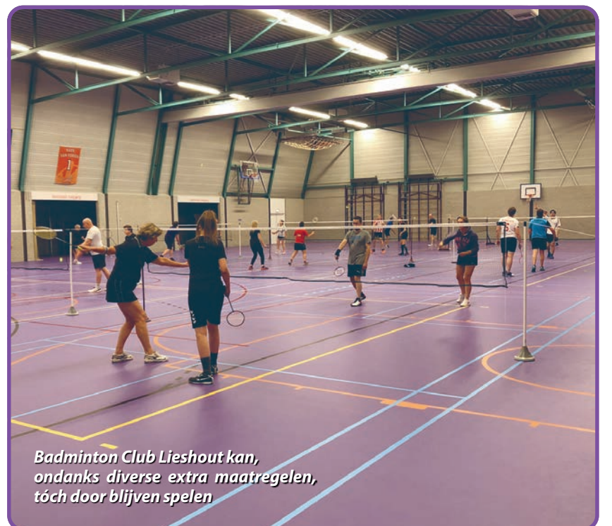
Badminton Club Lieshout kan, ondanks diverse extra maatregelen, toch door blijven spelen

Bij de senioren is het anders. Daar zijn diverse maatregelen nodig om aan de richtlijnen te voldoen. De training bij de senioren is vanwege het risico dat deelnemers dichter dan 1,5 meter bij elkaar komen voorlopig opgeschort. Bij de senioren zal de komende tijd dus alleen maar 'vrij' gespeeld kunnen worden. En, omdat ook bij het dubbelspel de '1,5 meter regel' niet gegarandeerd kan worden is ook besloten alleen nog maar singlepartijen te spelen. Omdat deze singlepartijen behoorlijk intensief zijn is ook besloten 'de klok' op 15 in plaats van 20 minuten te zetten, zodat partijen wat korter duren en er eerder gerust en gewisseld kan worden.