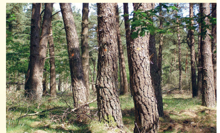
Voorbeeld van gemarkeerde en te vellen bomen

In het gemeentelijke bos op de Papenvoortse Heide staat voor dit najaar/winter een dunning op de planning. Dat betekent dat er bomen worden geveld om andere bomen