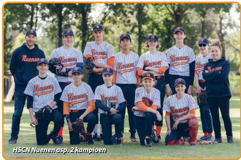
HSCN Nuenen asp. 2 kampioen