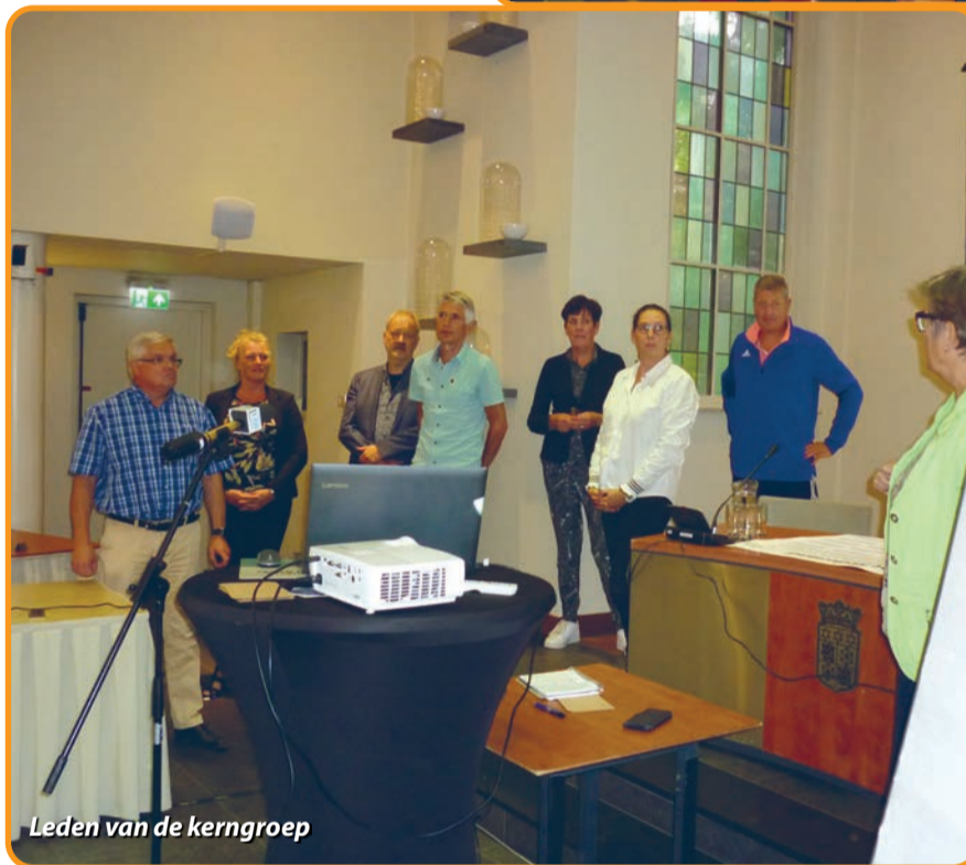
Leden van de kerngroep

21 Organisaties ondertekenden dit lokaal Sportakkoord Nuenen. Er staat jaarlijks € 20.000,- subsidie klaar gedurende drie jaar.