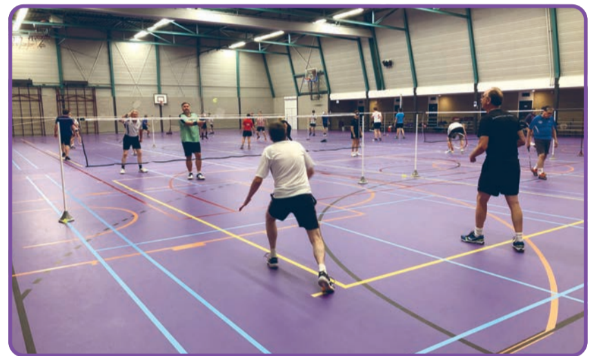
Badminton, een leuke en actieve sport voor iedereen

Doordat de inloopdagen ondersteund worden door Rabobank Helmond Peel Noord hoeft je niets mee te brengen. BCL zorgt voor een gehuurde accommodatie, met kleedruimte en sportzaal, zorgt voor leenrackets, zorgt voor voldoende shuttles en zorgt voor goede begeleiding. Kortom: alleen zorgen dat je sportkleding aan hebt is voldoende. Vind u ook dat Rabobank Helmond Peel Noord door deze ondersteuning een geweldige bijdrage levert aan het verenigingsleven in Laarbeek én aan de mogelijkheden om de jeugd van Laarbeek te laten sporten en dus gratis kennis te kunnen laten maken met een sportvereniging én bent u lid van de Rabobank Peel Noord? Stem dan komend najaar weer vóór financiële ondersteuning aan BCL, zodat deze ondersteuning voortgezet en uitgebreid kan worden, zodat alle jeugd van Laarbeek de mogelijkheid krijgt om bij een leuke vereniging te sporten.