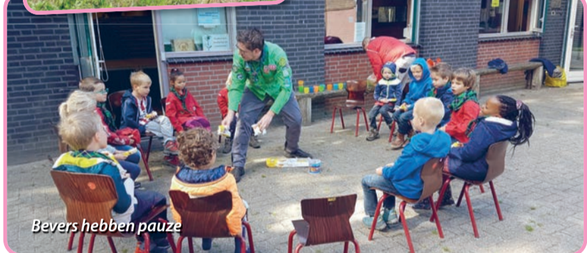
Bever hebben pauze