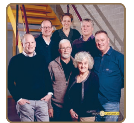
Dorpsraad Lieshout heeft voor zichzelf duidelijke aandachtsgebieden aangewezen, zodat zij goede actieplannen kan maken en concrete doelstellingen kan bereiken.

Op dit moment is de Dorpsraad nog bezig het beleidsplan af te ronden, zodat het gedeeld kan worden met de achterban en doelgroep: aan de