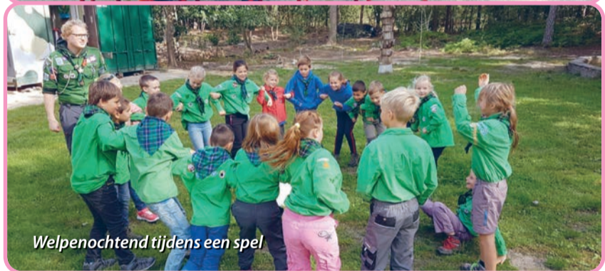
Welpenochtend tijdens een spel