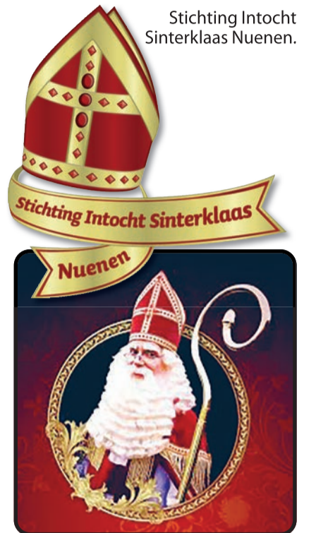
Stichting Intocht Sinterklaas Nuenen.

of zelfs in onze organisatie plaats te nemen? Neem dan even contact met ons op via info@sinterklaasnuenen.nl . Wij doen ons best er een leuk Sinterklaasfeest van te maken, wees lief voor elkaar en blijf vooral gezond.