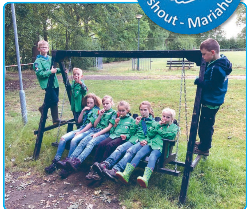
Een aantal welpen genieten op de schommelstoel van een verdiende traktatie na inspanning.