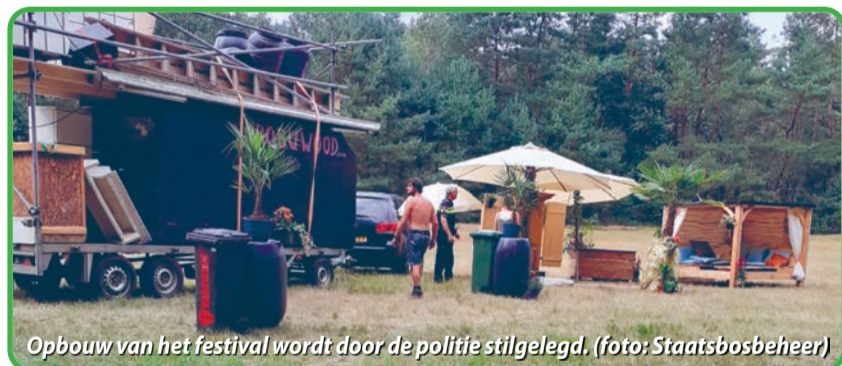
Opbouw van het festival wordt door de politie stilgelegd.

Om een en ander op een juiste en voor iedereen veilige manier te laten verlopen, vraagt Staatsbosbeheer de bezoekers om kennis te nemen van de regels op de toegangsborden van de terreinen en geplande evenementen en gebeurtenissen, groot en klein, te melden via de volgende link: www.staatsbosbeheer.nl/contact/evenement/melden-activiteit