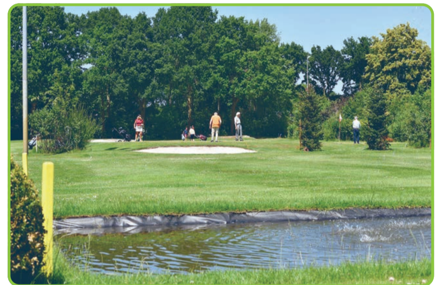
De schitterende vernieuwde baan van Golfclub Son

Wilt u zich aanmelden of gewoon meer info? Kijk dan op onze website: www.golfson.nl of op onze Facebook pagina www.facebook.com/golfclubson