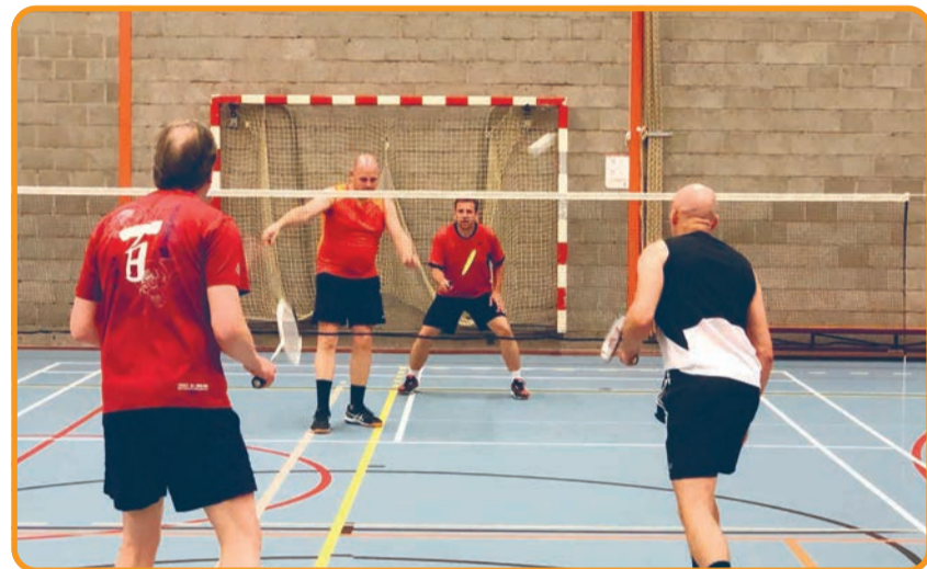
Spelers van BC Nueneen weer in hun vertrouwde sporthal

Wil jij ook je conditie in de zomer verbeteren? BC Nueneen nodigt je van harte uit om deze zomer op de vrijdagavonden gratis in de Hongerman te komen spelen. De jeugd van 8 t/m 13 jaar begint om 19.00 uur en de senioren vanaf 14 jaar starten om 20.00 uur. Het enige wat je nodig hebt is makkelijk zittende kleding en binnensportschoenen. Natuurlijk kun je je eigen racket meenemen maar BC Nueneen heeft ook rackets die je kunt lenen. Graag vooraf even aanmelden via www.bcnueneen.nl