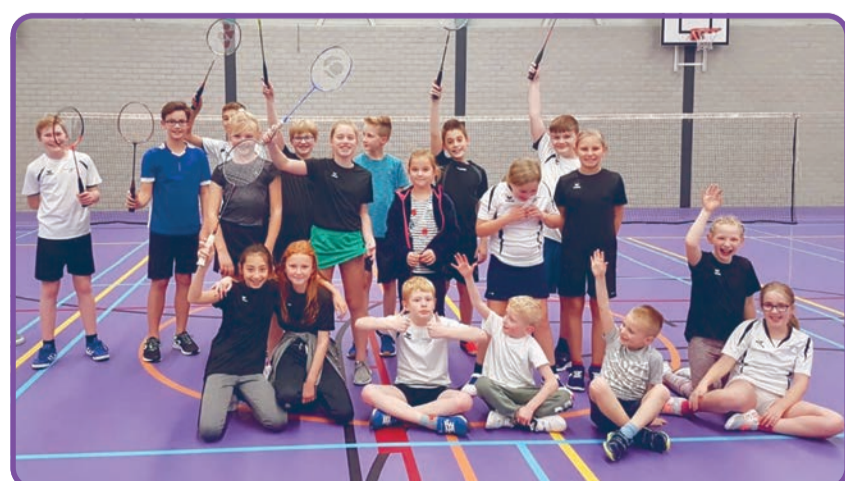
Badminton; een leuke sport voor alle leeftijden!

Woensdag, 8 juli, 18.30 uur: Laatste speelavond seizoen 2019/2020 Woensdag, 26 augustus, 18.30 uur: Eerste speelavond seizoen 2020/2021 Woensdag, 16 september, 18.30 uur: Eerste Rabobank inloopavond Woensdag, 23 september, 18.30 uur: Tweede Rabobank inloopavond.