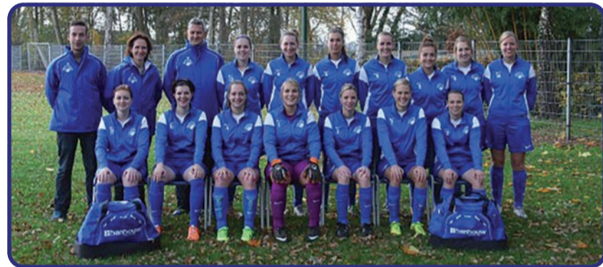
Vrouwen 1 RKVV Nederwetten

Vrijdag, 14 februari, 20.30 uur; Jaarlijkse Algemene Ledenvergadering. Woensdag, 19 februari, 20.15 uur: BCL-M2 - BC Vitesse-M1.