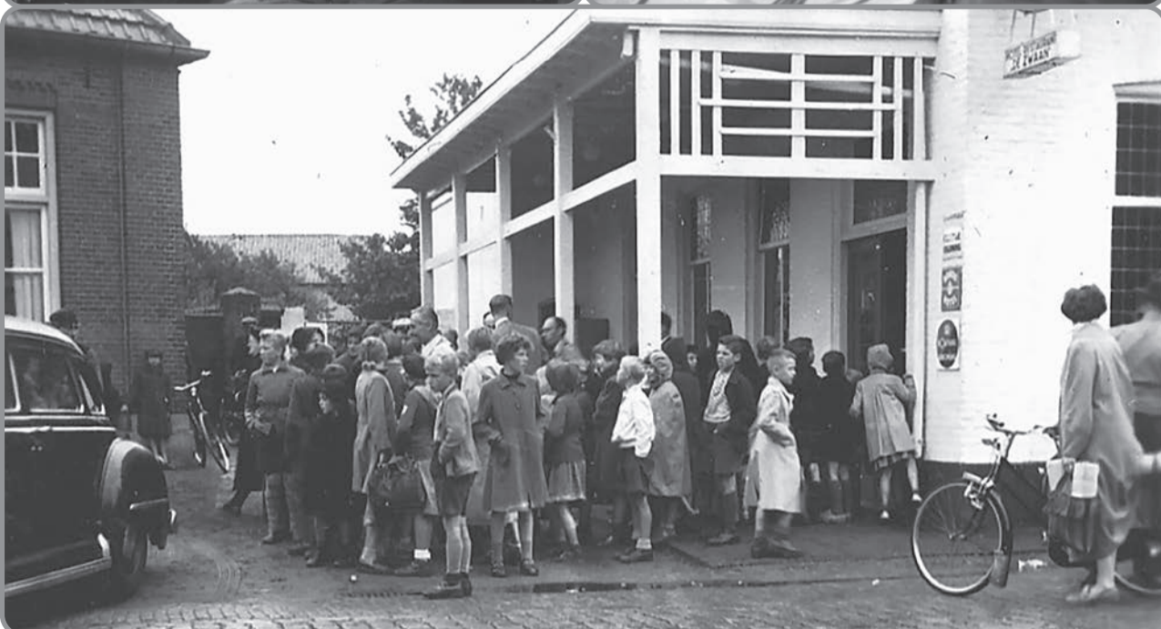
Kirk Douglas in De Zwaan, met veel belangstelling voor de Amerikaanse filmcrew