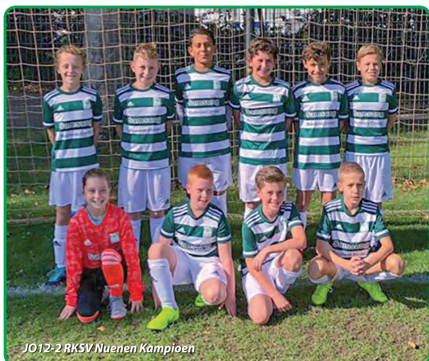
JO12-2 RKSJV Nuenen Kampioen

Het is zaterdag 14 december en het is koud. Maar vol enthousiasme en ook een beetje spanning in de benen betreden de 9 jongens en 1 dame van de JO12-2 het veld voor de wedstrijd van hun leven. Er staat veel op het spel. Bij winst zijn ze namelijk zeker van het kampioenschap! Iets dat de meeste spelers nog niet hebben meegemaakt in hun voetbalcarrière.