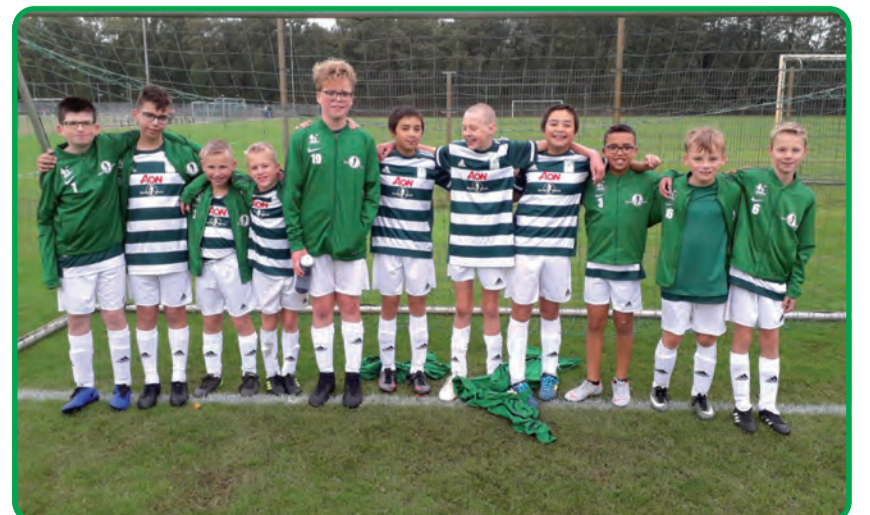
Het G-team van RKSJV Nuenen/Special Talents