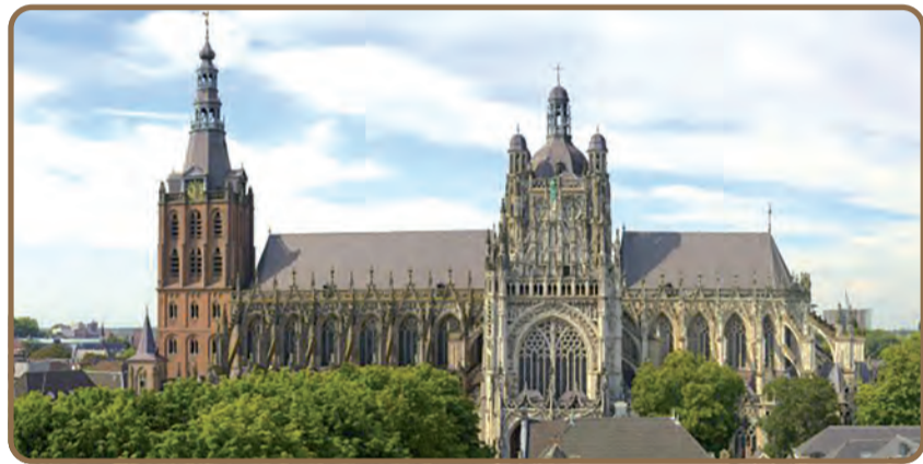
De Sint-Janskathedraal, in de binnenstad van 's-Hertogenbosch, wordt beschouwd als het hoogtepunt van de Brabantse gotiek