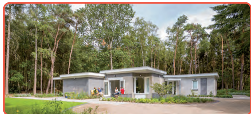
Bijna Thuis Huis Latesteyn in het bos aan de Pastoorsmast.

Fietsersbond, afd. Nuenen Veilig Verkeer Nederland, afd. Nuenen