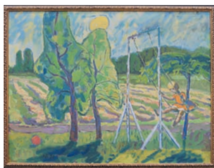
Kind op schommel - Hugo Brouwer

Gedurende het driedaagse festival zal het aanbod dagelijks wisselen en zijn er kunstwerken te vinden binnen ieder