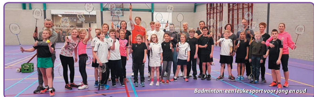
Badminton: een leuke sport voor jong en oud

speelavonden zullen eerst de grondbeginselen van het badminton worden bijgebracht, uiteraard in combinatie met het spelen van wedstrijden en het doen van oefeningen die gerelateerd zijn aan de badmintonsport. Je kunt overigens altijd twee keer gratis meespelen voordat je moet besluiten om lid te worden. Zo kun je dus eerst rustig kijken of de sport iets voor je is en hoe je niet meteen lid te worden. Ook een racket hoeft je niet meteen te kopen. Deze kun je gebruiken van de vereniging, die hier een speciaal aantal rackets voor op voorraad heeft (inclusief enkele rackets met verkorte steel). Kortom; geen enkele drempel om het eens te komen proberen. Kom daarom op een van de komende woensdagavonden om 18.30 (of 19.15) uur naar 'Sporthal De Klumper'. Als je sportkleding meebrengt kun je meteen meedoen en ervaren hoe leuk badminton kan zijn.