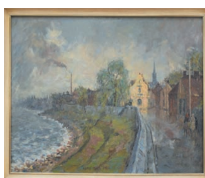
Grimlinghausen am Rhein - Harry Maas

budget, dus ga vooral zelf een kijkje nemen bij Art Dumay, Cockveld 4 in Nuenen. Tijdens dit weekend krijgt u 15% korting op een inlijsting bij Lijsienmakerij Foederer (voorheen Helmond), tevens gevestigd in het pand van Art Dumay.