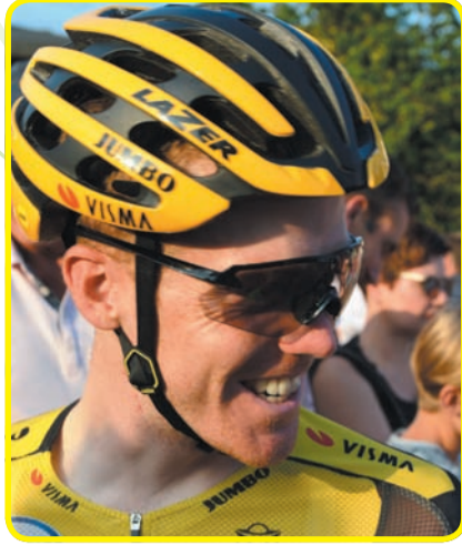
Steven Kruijswijk gaat zaterdag van start in de Ronde van Spanje....