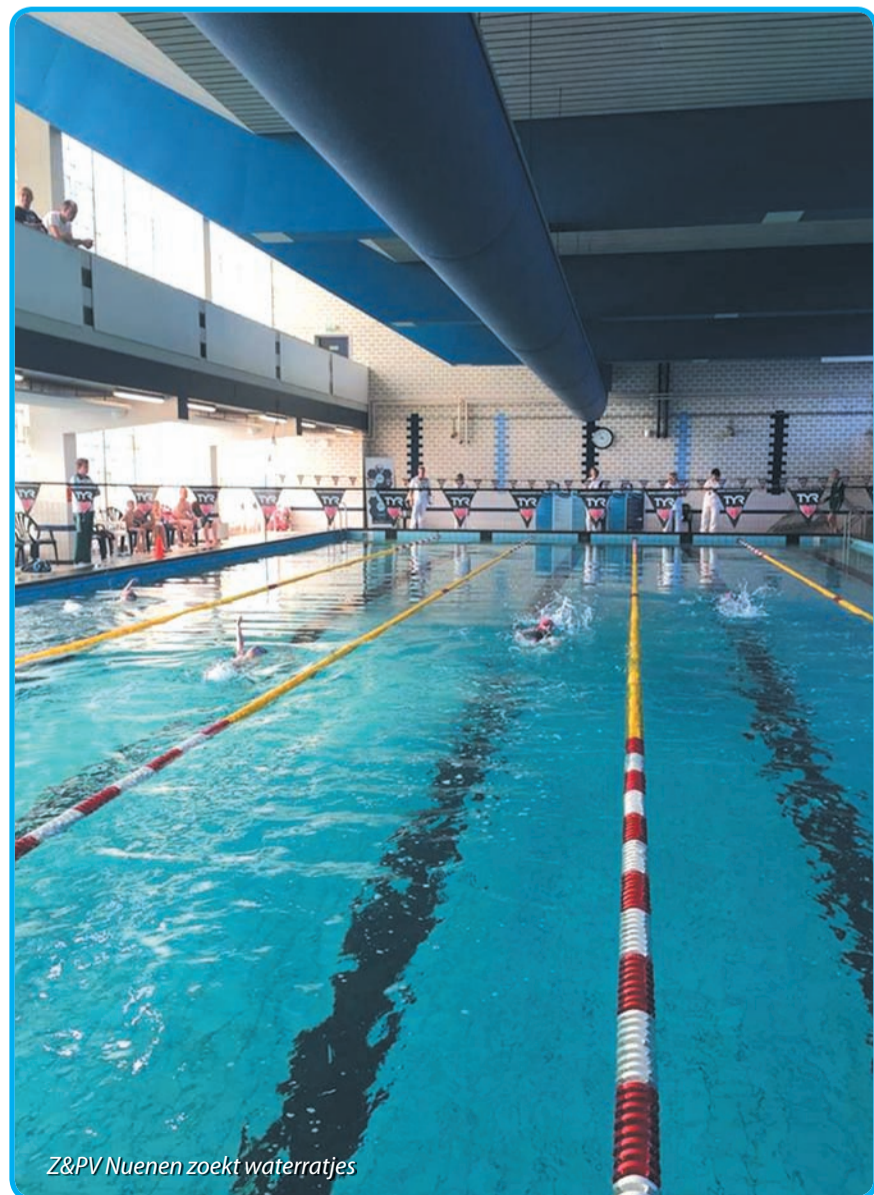
Z&PV Nuenen zoekt waterratjes

deelnemen aan stickerzwemmen, waarbij in korte blokken allerlei takken van sport aan bod komen zoals survivalzwemmen. Hoewel wij natuurlijk de technieken willen verbeteren, staat plezier bij ons altijd voorop. Wie durft er bijvoorbeeld mee te doen met een van onze bommetjeswedstrijden of onze clubkampioenschappen? Net zo enthousiast als wij om een duik te nemen? Kijk dan eens op onze website www.zpvnunen.nl of op onze facebookpagina www.facebook.com/zpvnunenrecreatief en neem nu contact op voor drie gratis proeflessen. Interesse in een andere tak van sport? Kijk dan eens bij een van onze andere afdelingen: wedstrijdzwemmen, masters, synchroonzwemmen, waterpolo of snorkelen & duiken.