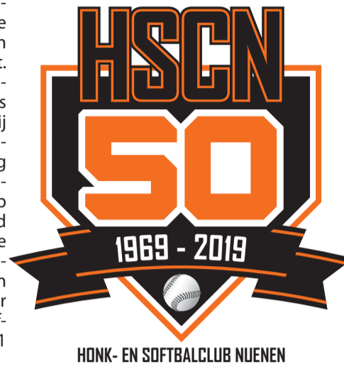
HONK- EN SOFTBALCLUB NUENEN

Wil je meer info ontvangen over deze reünie dag op Sportpark de Lissevoort? Meld je dan aan voor deze dag via email redactie@hscn.nl