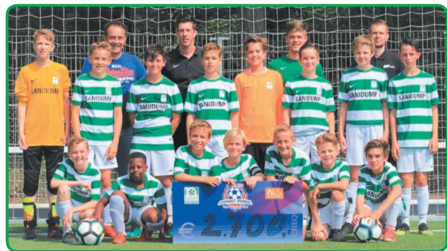
JO13 van RKSv Nuenen na competitiewinst ook kampioen voor goed doel