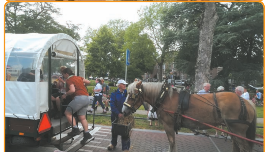
Een gezellige drukte, afgelopen zondag in het Park. De jaarlijkse Processie van Valkenswaard naar Handel stopt twee keer in Nuenen: 's zaterdags op de heenweg in de ochtend, 's anderdaags op zondag in de middag. Even uitrusten, verzorgen en veel drinken, ook voor de paarden.