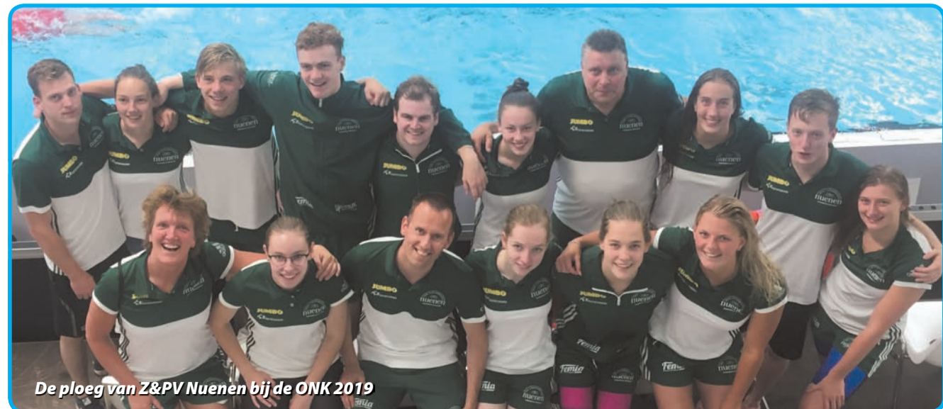
De ploeg van Z&PV Nuenen bij de ONK 2019