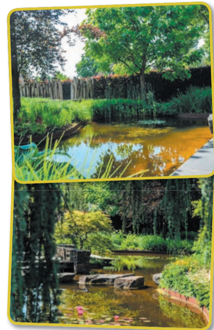
om de eerste prijs toegekend voor mooiste tuin van het jaar 2019".