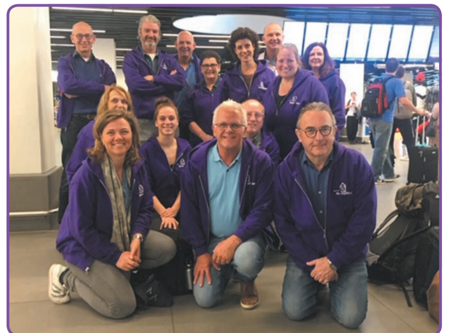
Op de foto de namen van de deelnemers.

Komende weken zullen we jullie nog een verslag doen van deze geweldige ervaring door BouwTeam Nuenen.