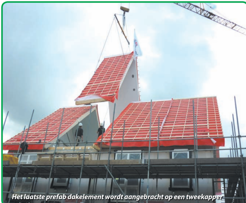
Het laatste prefab dakelement wordt aangebracht op een tweekapper

plan gerealiseerd wordt. Ook uitvoerder Bennie Maas werd uitgebreid in het huldebeton betrokken en hij ontving een envelop met € 1000,- inhoud van Bouwbedrijf van Santvoort en Sankomij. Dit bedrag wordt bij de eerder ontvangen € 1000,- gelegd die tijdens het slaan van de eerste paal geschonken werd door Gerwen Zo om een kunstwerk in de wijk te plaatsen. De vele aanwezige kopers maakten gretig gebruik van de mogelijkheid om hun in aanbouw zijnde woning of de in ruwbouw gereed zijnde woningen, te bezoeken. Bijna alle woningen zijn verkocht. Nog een paar tweekappers en een seniorenwoning aan de Ter Waarden zijn nog beschikbaar. De openingshandeling bestond uit het hijsen van een prefab dakgedeelte op een tweekapper door een afstandsbediening met een kraanmachinist, geassisteerd door wethouder Caroline van Brakel en Harrie van Lieshout.