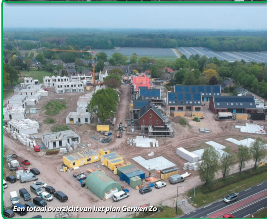
Een totaal overzicht van het plan Gerwen Zo