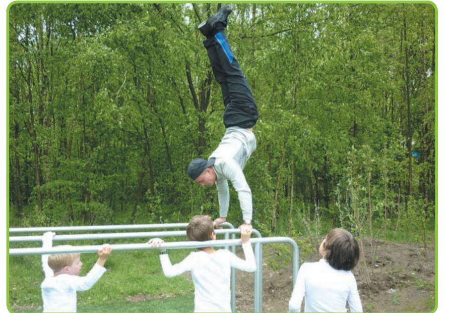
Oudere en jonge jeugd maakten direct gebruik van de nieuwe voorzieningen

Voor het bijhouden en onderhouden van deze nieuwe voorzieningen wil de gemeente in contact komen met groepen van gebruikers om samen te zorgen voor een schone en veilige voorziening.