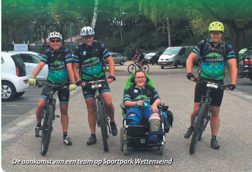
De aankomst van een team op Sportpark Wettenseind