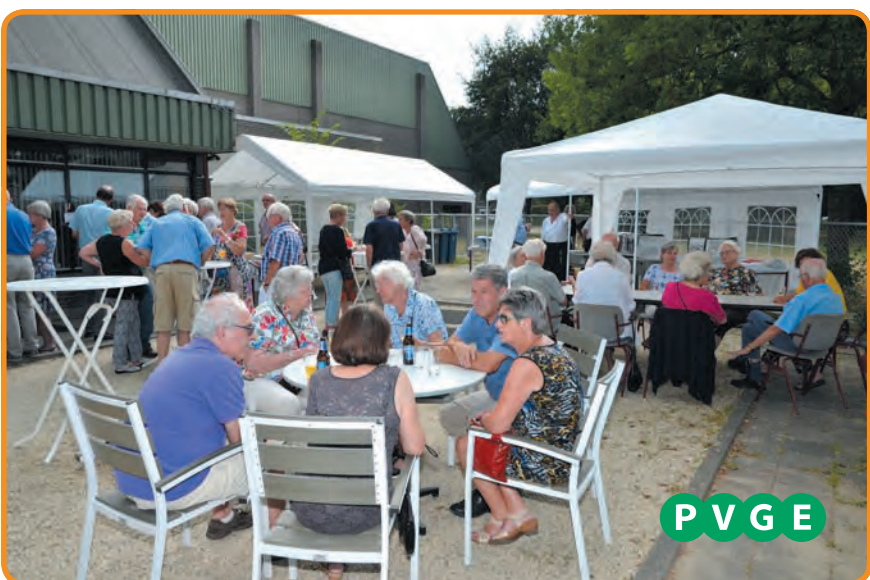
Het Kwetternest BBQ

Voor wie het nog niet weet: het Kwetternest beschikt over een eigen keuken, waarin maar liefst zes kookclubs actief zijn. De PVGE Nuenen telt meer dan 1000 leden en heeft meer dan 40 clubs. Meer weten over de activiteiten van deze actieve seniorenvereniging, kijk dan op de website van PVGE Nuenen: https://nuenen.pvge.nl .