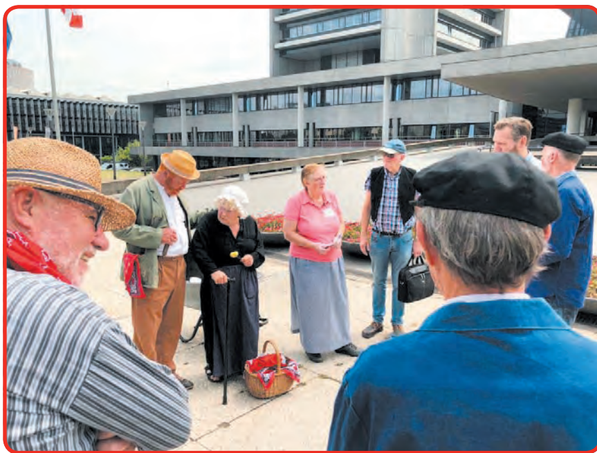
Leden van het actiecomité Nuenen c.a. Zelfstandig staan als Nuenense boeren en boerinnen met 'Vincent van Gogh' voor het Provinciehuis. De volle kruiwagen met bezwaren staat er nog verscholen bij