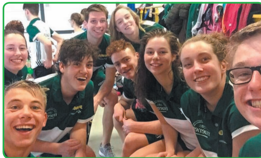
Zwemmers van Z&PV Nuenen tonen trots hun nieuwe clubkleding