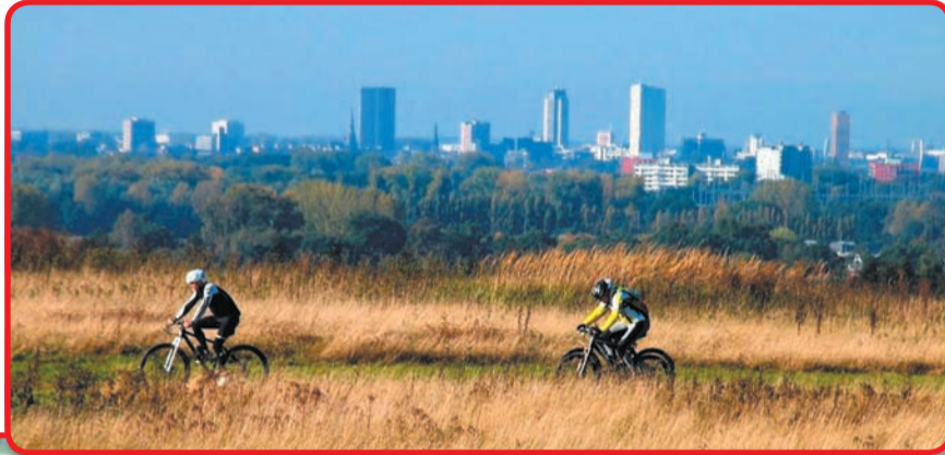
Mountainbikers in actie op het 'Dak van Brabant' in Nuenen.

Mierlo. In het parcours zitten steile klimmetjes en spectaculaire afdalingen. Halfweg de routes krijgen deelne-