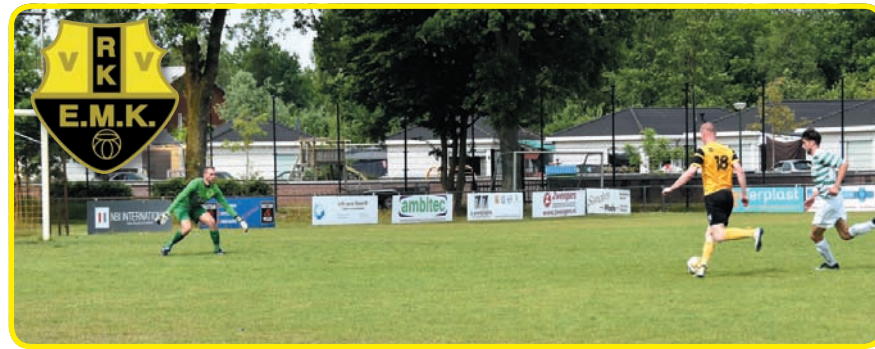
Tom van Elst bezig met een actie.

EMK treft a.s. zaterdag tegenstander Hapert in een uitwedstrijd. Maandag 5 juni volgt dan de return op sportpark Wettenseind, waar de beslissing zal vallen in deze nacompetitie. Edwin Cuppen was deze wedstrijd de Man of the Match aan EMK zijde.