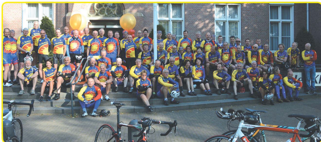
De organisatie van de Van Goghfietsstoertocht berust bij ToerClub Nuenen. Iedereen kan meedoen aan deze fietstocht....

voor vertrek in te schrijven bij café Schafrath Park 35 in Nuenen. Dat kan zondagmorgen 18 juni tussen acht en negen uur. Deelname kost voor leden van de Nederlandse Toerfietsunie (NTFU) drie euro en voor andere deelnemers vier euro. Voor meer informatie zie ook de site van de organisatie www.tcnuenen.nl