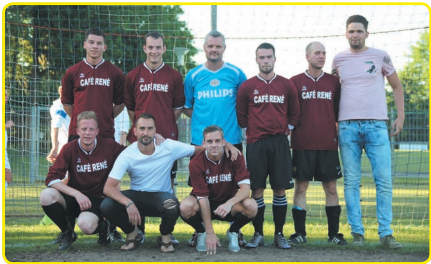
Café René wint sponsortoernooi bij RKVV Nederwetten.

De organisatie wil bij deze alle sponsoren, vrijwilligers en deelnemers nogmaals hartelijk bedanken voor jullie hulp en aanwezigheid.