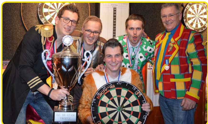
DFJB met darters van Goesting: winnaar bij de wedstrijdarters....