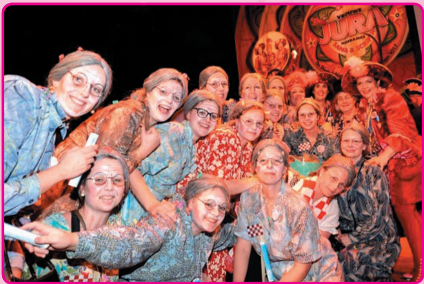
1e prijswinnaars 2017 Grote Groep; 'Dees Brabants Babes Bruisen Nog wel efkes dur'!