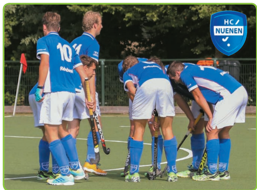
De mannen van Nuenen H1 maken zich op voor een van de corners waar een doelpunt uit viel thuis tegen Goirle

mee te draaien in het linker rijtje van de Tweede Klasse en dus zullen zij er alles aan doen om komend weekend ook in Veldhoven bij Basko de drie punten mee naar huis te nemen. Op 2 oktober spelen de mannen pas weer thuis, dan tegen het eerste van Maastricht om 14.45 uur. Deze ploeg heeft net als Nuenen na twee wedstrijden zes punten behaald, dus dat belooft een mooie wedstrijd te worden. Ook dan hopen de Nuenense mannen weer veel supporters langs de lijn te zien!