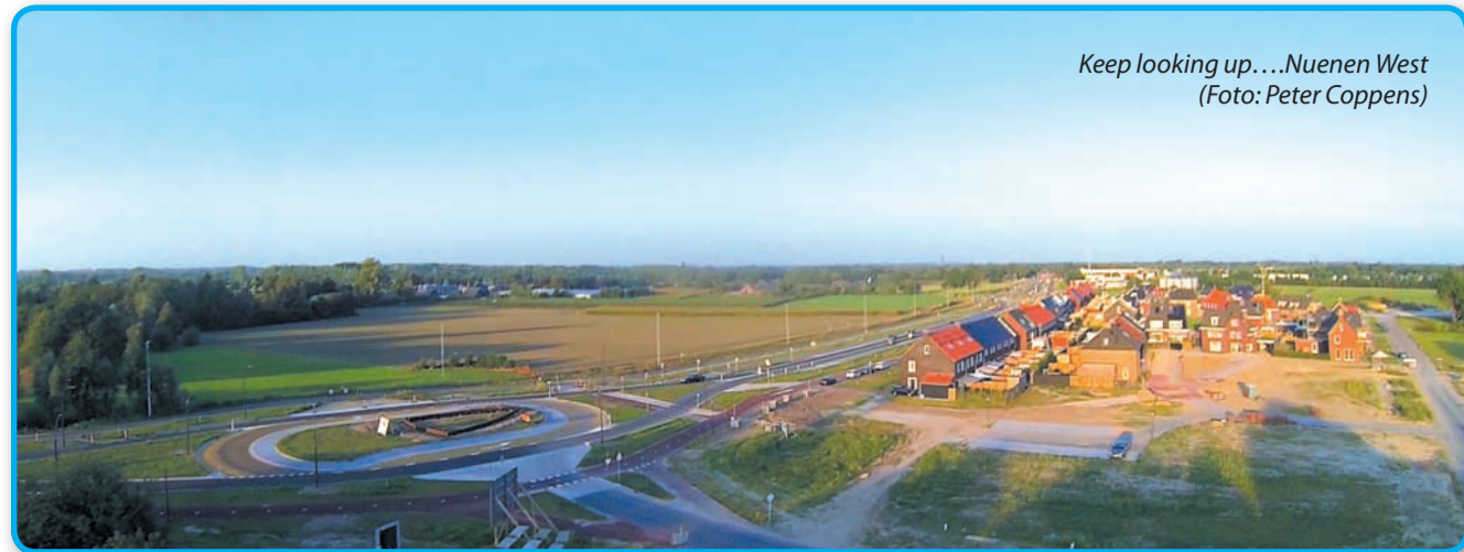
Keep looking up...Nuenen West

Met betrekking tot de Toekomst van Nuenen zelf vinden wij in het advies veel terug van onze eigen standpunten, zoals verwoord in ons verkiezingsprogramma 2014-2018. Daarin wordt al gehamerd op intensieve samenwerking in de Dommelvallei en daarnaast op een krachtiger samenwerking in de regio. Recentelijk heeft D66 bij de nieuwe coalitievorming in Nuenen in het voorjaar sterk benadrukt dat zij volop inzet op versterking van de bestuurskracht, mede op basis van de uitkomsten van het Bestuurskrachtonderzoek. Bij de gevraagde input voor de Cie. Demmers hebben we de noodzaak van versterking van de bestuurskracht van Nuenen ook benadrukt, en de mogelijkheid van een bestuurlijke fusie binnen de Dommelvallei nadrukkelijk opgehouden. We hebben ook benadrukt dat wat ons betreft Nuenen van harte meewerkt aan de positionering van de vraagstukken m.b.t. wonen, werken, ruimtelijke inrichting en voorzieningen op het niveau van het Stedelijk Gebied Eindhoven.