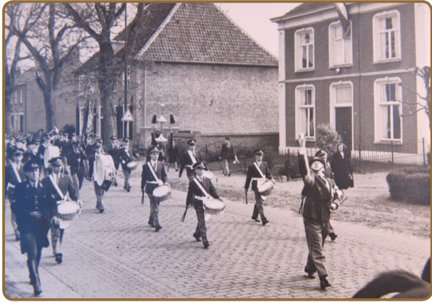
De foto van het muziekkorps bij Pastorie en Nune Ville dateert uit ca. 1960.

van 19.00 uur tot 21.30 uur. De lezing is openbaar en gratis toegankelijk. Locatie: Wijkcentrum Blixems, Overture 2, Eindhoven. Vragen? Bel gerust: 06 83 40 78 50 of mail: info@rveindhoven.nl .