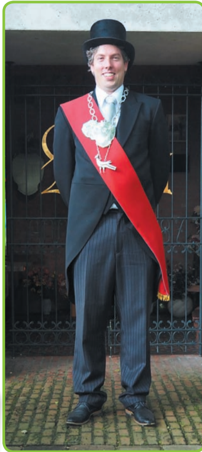
Installatie bij de St. Antoniuskapel op het Eeneind. (foto Piet v.d. Laar).

Van 17.00 - 18.00 uur wordt het festival op de kiosk afgesloten door NL Roots Band Ronald Verstappen. Bij slecht weer is er voor de buitenpodia een vervangende locatie geregeld. Wie iets heeft met Brabant en Brabants dialect wil dit festival niet missen. www.brabantsdialectenfestival.nl