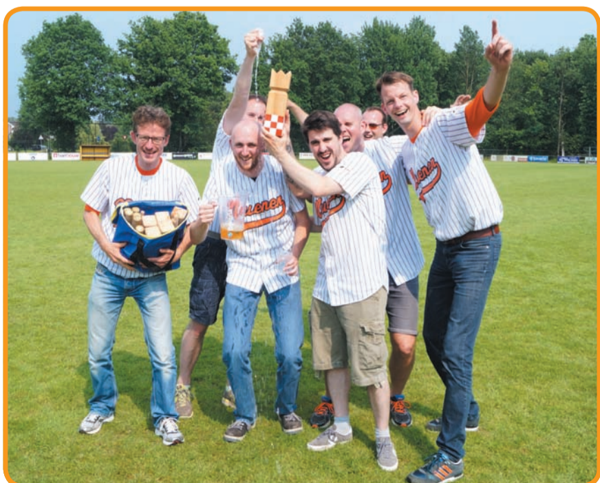
De trotse winnaars van OBKK: HSK uit Nuenen.

blok' in Zweeds dialect en kan kort worden omschreven als een combinatie van bowlen, Jeu de boules en schaken. De regels variëren per land en regio, maar het doel van het spel is altijd om de koning omver te gooien voordat de tegenpartij dat doet. Dit, in combinatie met de grote hoeveelheid strategie die kan worden toegepast door de spelers, heeft ertoe geleid dat sommige spelers en kubbfans het spel de bijnaam 'vikingschaken' hebben gegeven. Het spel kan binnen dertig seconden gespeeld zijn, maar kan ook uren duren. Ook kan het worden gespeeld op diverse ondergronden, zoals zand, beton of gras en zelfs op sneeuw.